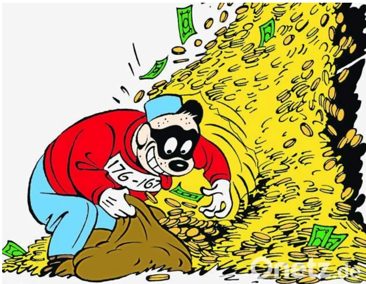
Братья Гавс за работой

Самое большое преимущество физически хранящегося золота сейчас заключается в том, что оно не подвержено контрагентским рискам, о которых я писал выше. Единственный риск, которому подвергается человек, физически хранящий золото, - это кража. Скруджд Макдак как никто другой мог бы поведать вам об этом.