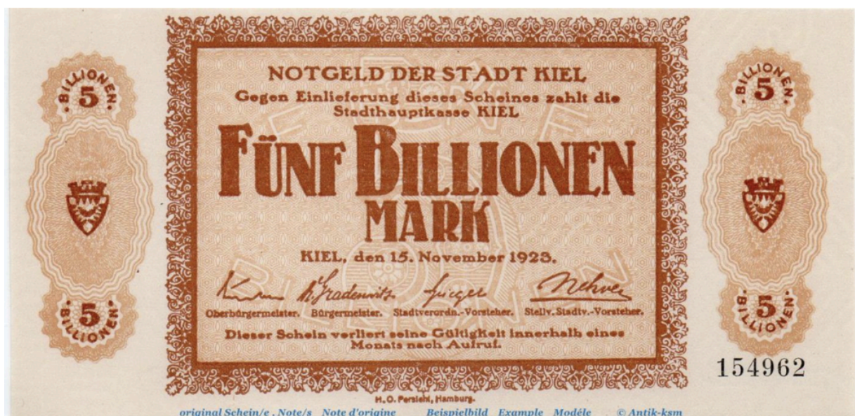
Банкнота номиналом 5 триллионов марок 1923 года

Центральный банк не может обанкротиться, потому что он может печатать неограниченное количество денег, поэтому теоретически это невозможно, чтобы владелец банкнот потерял все. Я говорю "теоретически", потому что на практике это вполне возможно и уже происходило.