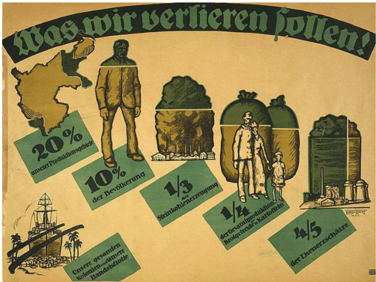
Потери Германской империи в результате Версальского договора на современной гравюре.