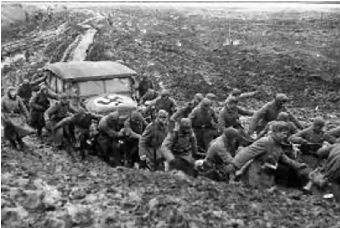
Распутица на несколько недель парализовала наступление немцев в 1941 г.

Немецкий вермахт погрузился в грязь осенью 1941 года. Он практически был остановлен. Потерянное время стало одной из причин того, что вермахт потерпел свое первое крупное поражение под Москвой в декабре 1941 года, от которого он так и не смог оправиться.