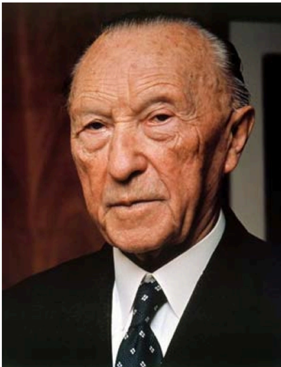
Конрад Аденауэр – читатель NZZ

Согласно своей собственной версии, NZZ получила прозвище "старая тетушка" в первой половине 20-го века. Прозвище, имеющее в то время пренебрежительное значение, превратилось в ласковый термин для крупной газеты.