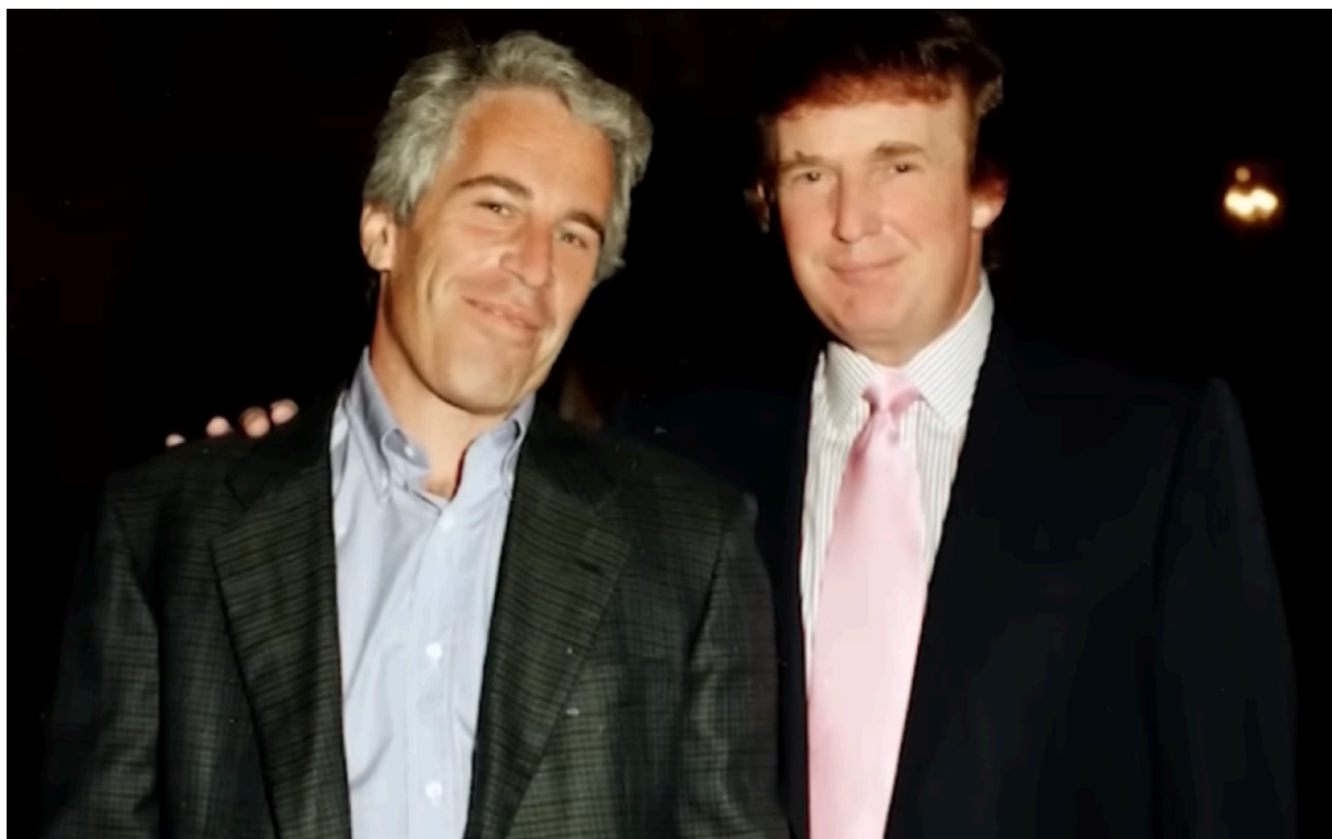
Джеффри Эпштейн (слева) с Трампом (справа) в лучшие времена, скриншот из передачи CNN .

Известный американский телеведущий и политический комментатор Такер Карлсон , который активно поддерживал Трампа во время выборов, сейчас критикует его. В частности, он выступает против попыток Трампа скрыть своё участие в весьма неприятном деле Эпштейна и отказа раскрыть соответствующие документы .