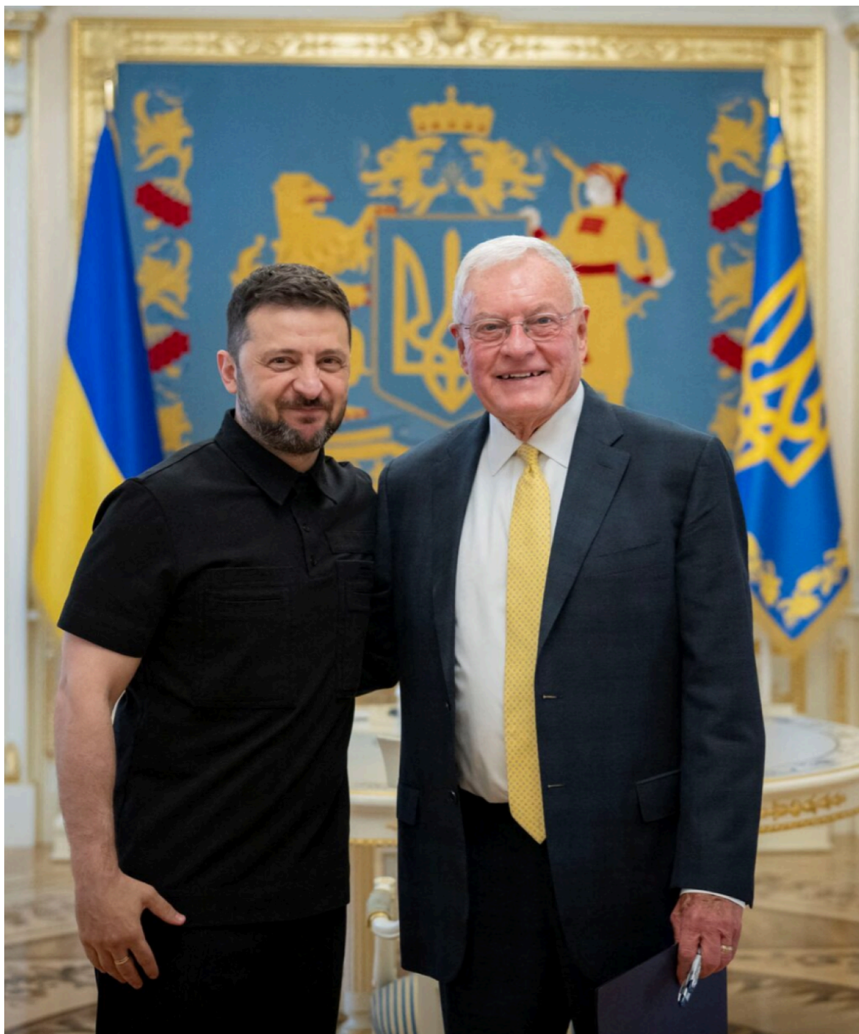
Президент Украины Владимир Зеленский с специальным представителем США по Украине Китом Келлогом 14 июля 2025 года в Киеве, Украина.

По-прежнему речь идет о сотрудничестве соответствующих спецслужб, ужесточении санкций против России, расширении военной помощи США и максимальных требованиях к России, которая после этого должна немедленно капитулировать. О «нормализации» отношений с Россией и речи не идет.