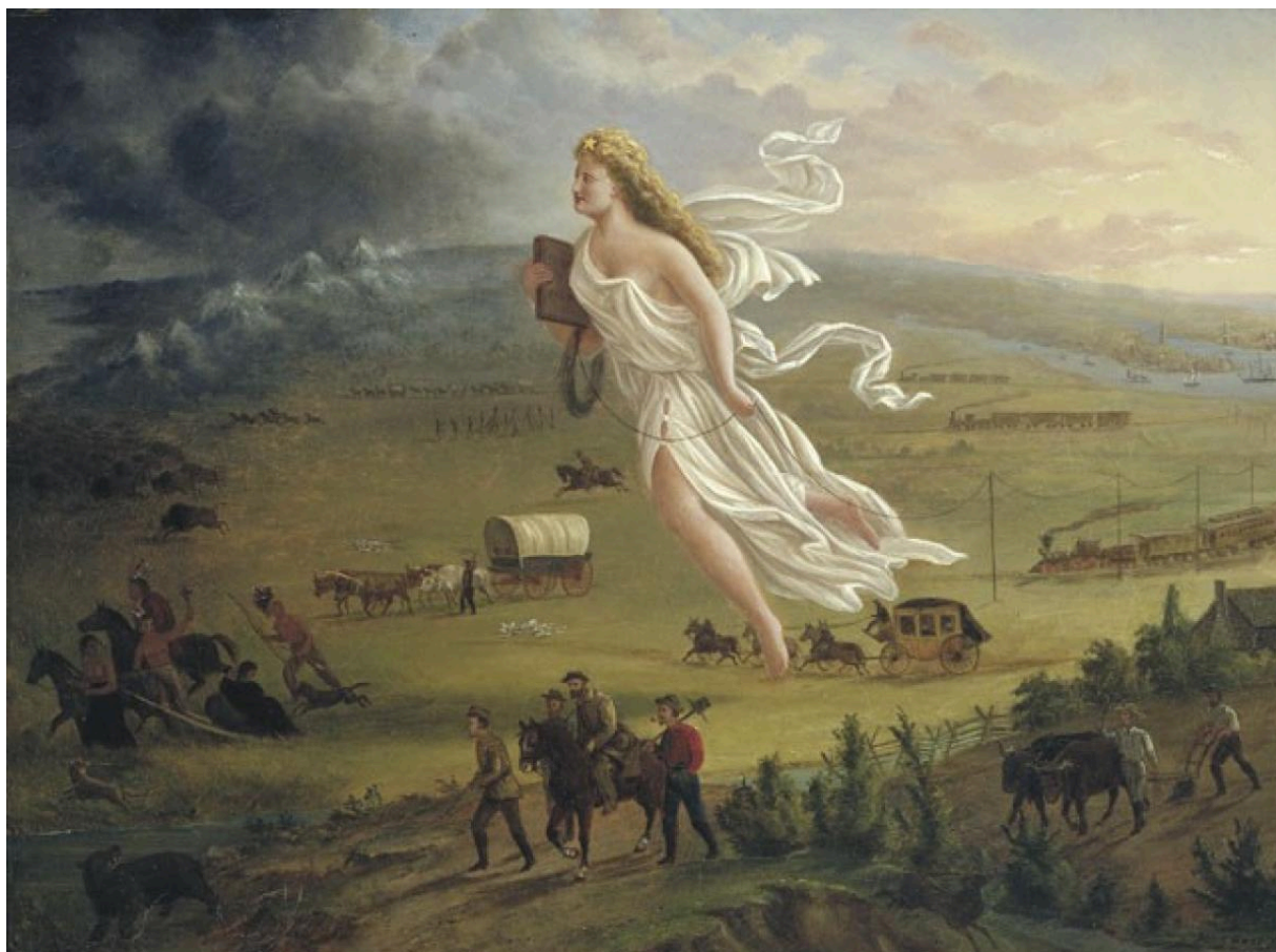
Картина Джона Гаста, прим. 1872 г.

В этом аллегорическом изображении «Манифеста судьбы» фигура Колумбии олицетворяет Соединенные штаты, которые несут американским поселенцам «свет цивилизации» на Запад и изгоняют коренных жителей и других диких животных. Колумбия тянет телеграфный провод и держит в правой руке школьный учебник. Западные самопровозглашенные мировые державы по-прежнему живут в таком воображаемом мире.