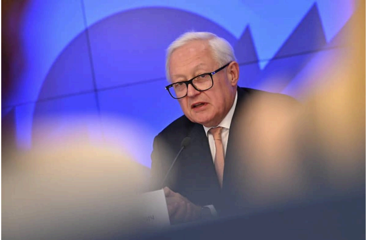
Сергей Рябков

договорились упростить режим передвижения дипломатов и разработать «дорожную карту» по конфискованному российскому дипломатическому имуществу.