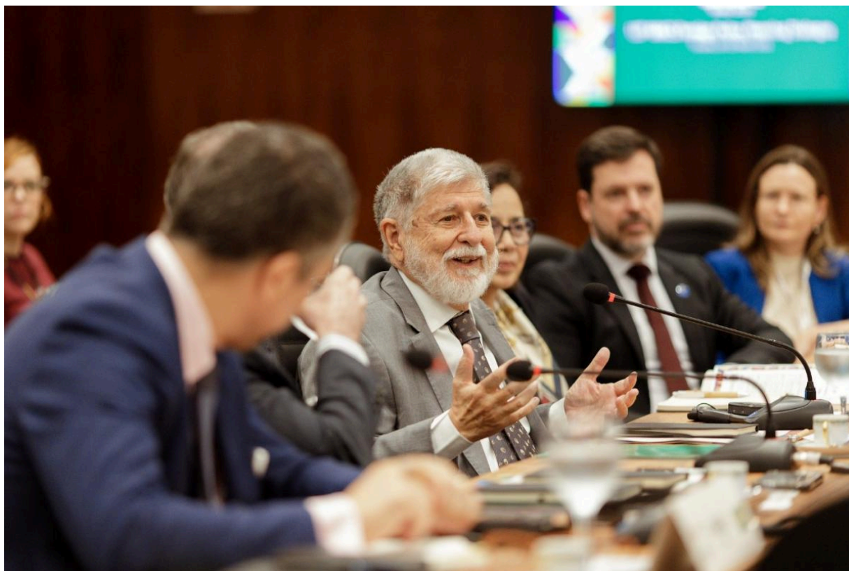
Посол Селсу Аморим

Селсу Аморим, бразильский дипломат и один из основателей БРИКС, подчеркнул: