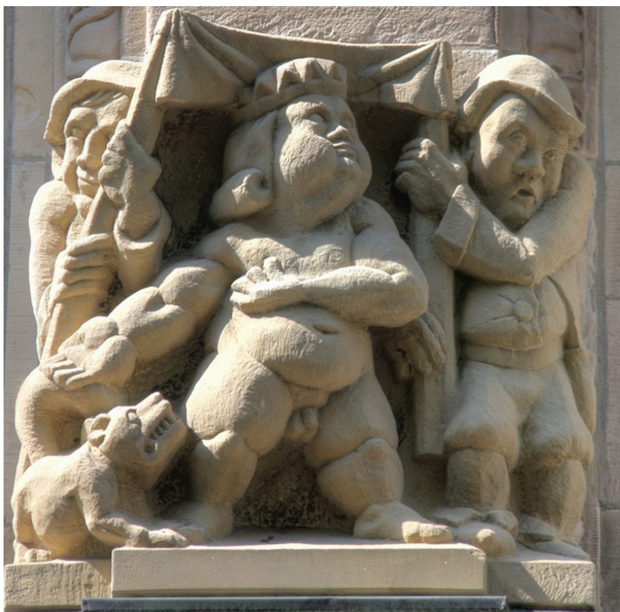
В Кельне стоят небольшие фасадные скульптуры из сказки «Новое платье короля» Ганса Христиана Андерсена.