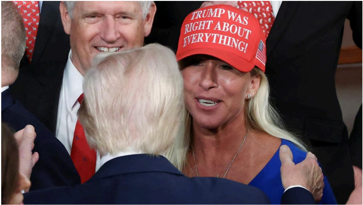
Марджори Тейлор Грин с Трампом

Конгрессвумен штата Джорджии от республиканцев Марджори Тейлор Грин (MTG) недавно неожиданно отвернулась от Дональда Трампа, хотя долгое время была одной из его самых верных сторонниц. Она заявила газете Times, что американцы «устали» от конфликтов в дальних странах. Она резко осудила заявление Трампа о поставках оружия Украине через НАТО. По ее мнению, это предательство принципа «Америка превыше всего» и риск втянуть США в новую войну. Она говорит о нарушении слова: