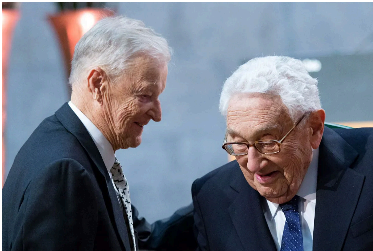
Збигнев Бжезинский (слева) с Генри Киссинджером, декабрь 2016 г.

Дэвид Рокфеллер не «изобрёл» Бжезинского , но он способствовал его продвижению как в институциональном, так и в сетевом стратегическом плане: сначала через Совет по международным отношениям (Council on Foreign Relations), а затем целенаправленно через Трёхстороннюю комиссию. Именно там Бжезинский получил площадку для реализации своих идей. Так он стал советником по избирательной кампании Линдона Б. Джонсона с 1966 по 1968 год, а затем — советником по национальной безопасности президента Джимми Картера с 1977 по 1981 год. Его книга "Единственная мировая держава", посвящённая англосаксонской геополитической стратегии, до сих пор считается актуальной классикой.