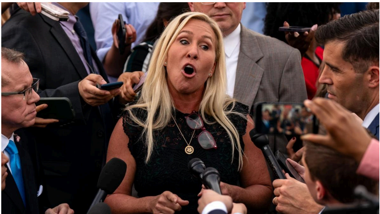
Марджори Тейлор Грин в распале

Конгрессвумен штата Джорджии от республиканцев Марджори Тейлор Грин (MTG) недавно неожиданно отвернулась от Дональда Трампа, хотя долгое время была одной из его самых верных сторонниц. Она заявила газете Times, что американцы «устали» от конфликтов в дальних странах. Она резко осудила заявление Трампа о поставках оружия Украине через НАТО. По ее мнению, это предательство принципа «Америка превыше всего» и риск втянуть США в новую войну. Она говорит о нарушении слова: