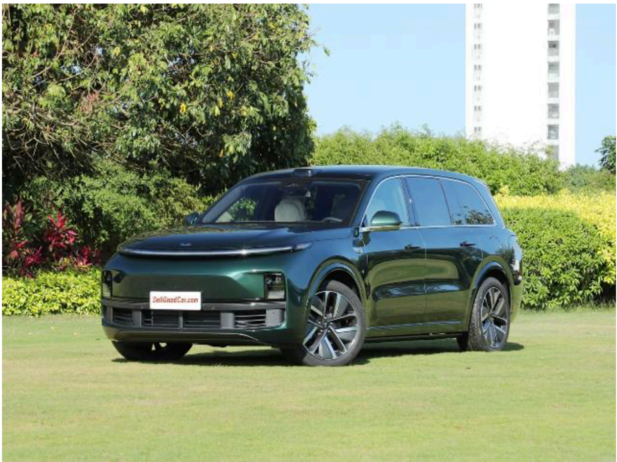
Li-9 - пугает немецкий автопром

Конечно, LI-9 не продается в Швейцарии или Германии - вам придется ехать в Россию. Русские любят красивые автомобили, а немецкие политики уже три года держат дверь в гигантскую империю открытой для китайцев - Москва просто кишит LI-9.