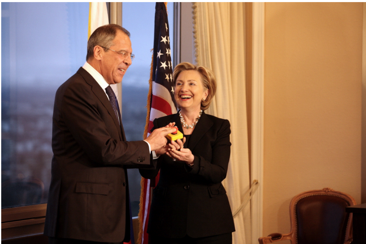
Сергей Лавров и Хиллари Клинтон 2009 - новое начало, которого не произошло

Результат побудил США начать в марте 2009 года «наступление очарованием» на Россию, чтобы выиграть время. Хиллари Клинтон вручила Сергею Лаврову «кнопку перезагрузки» - кнопку возобновления отношений.