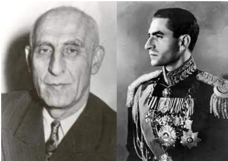
Премьер-министр Мохаммад Моссадег - Шах Мохаммад Реза Пехлеви

Например, в 1953 году ЦРУ вместе с британской МИ-6 свергли демократически избранного премьер-министра Ирана Мохаммеда Моссадега в ходе операции АЖАХ, чтобы вернуть шаха на павлиний трон. Причиной, как это часто бывает, было черное золото.