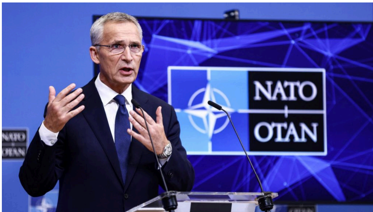
Йенс Столтенберг: глава клуба пустословия

Бряцание оружием НАТО, вероятно, больше похоже на бряцание оружием США по второму каналу.