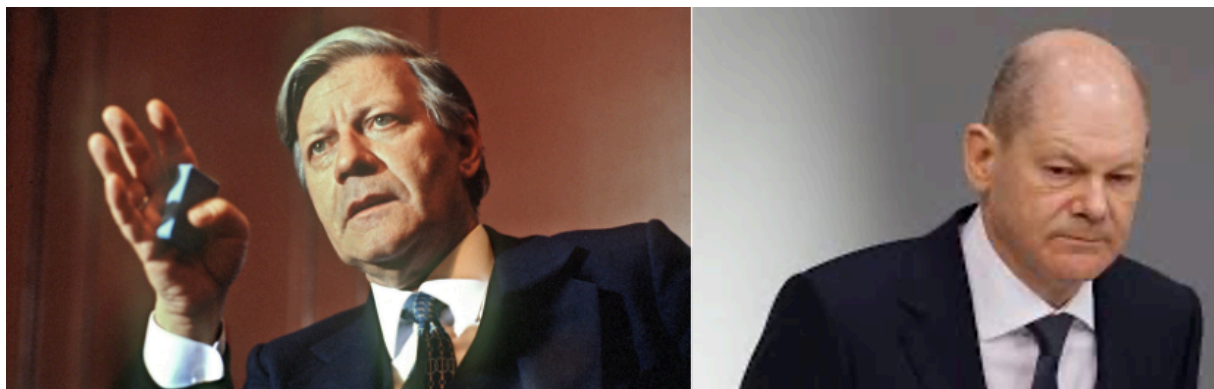
Сильные и слабые кадры

заявил: "Те, кто ведут торговлю друг с другом, не стреляют друг в друга". Таким образом, годы перетягивания каната вокруг "Северного потока", завершившиеся его частичным разрушением, предстают в ином свете с этой точки зрения.