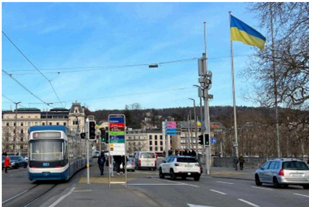
Украина - новая Швейцария! - Развешивание украинских флагов в Цюрихе

Крах России предрекают еще с прошлой весны. Помните, как весной 2022 года западные СМИ в унисон заявляли, что у русских к маю закончатся боеприпасы, что в России начнется гражданская война, что санкции поставят Россию на колени, что Путин при смерти и что Украина - это новая Швейцария?