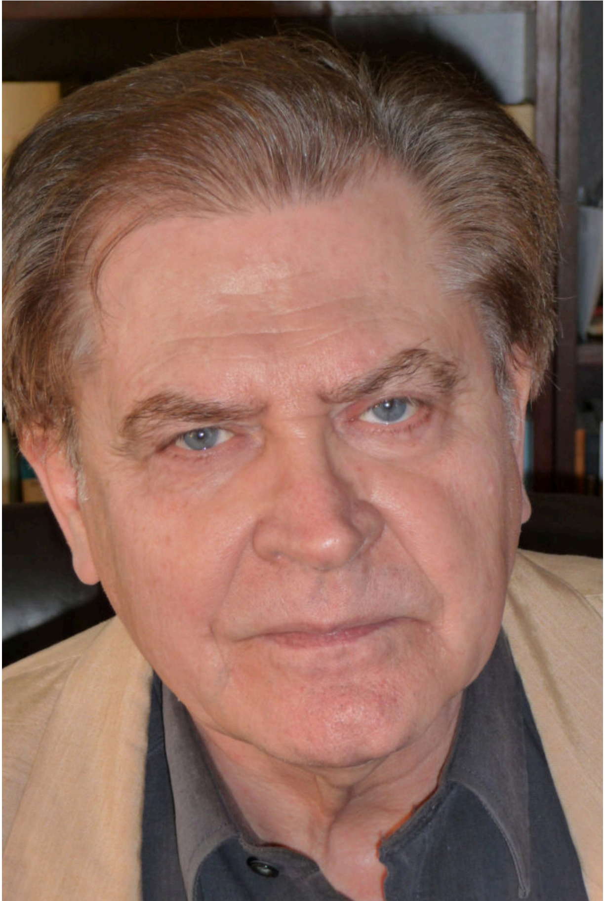
Д-р Вольфганг Биттнер