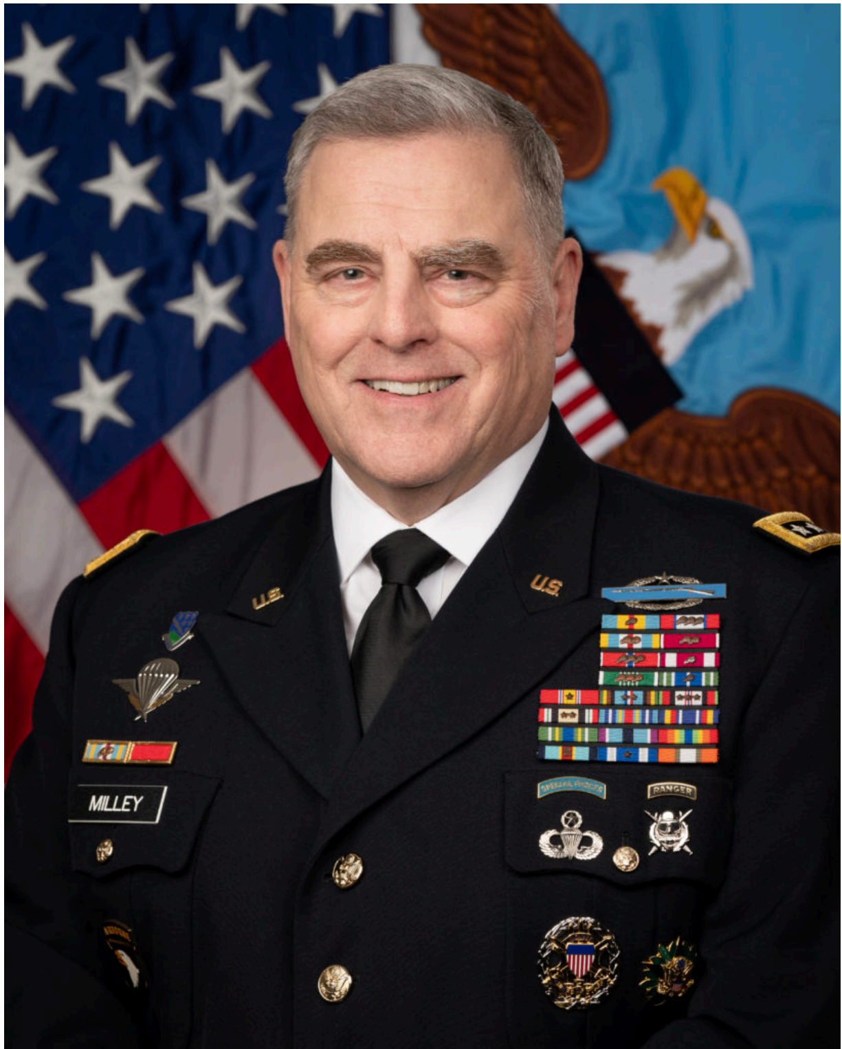
Генерал Марк Милли - дежурный болтун

Таким образом, американской армией руководит болтун, не вызывающий абсолютно никакого доверия - результаты подтверждают это.