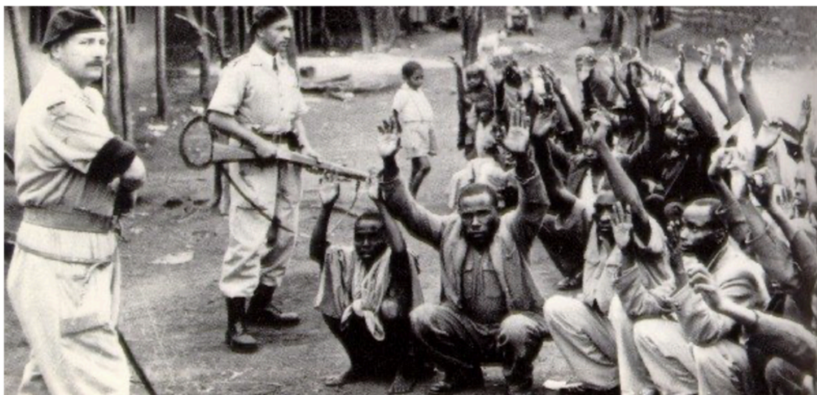
Британские колониальные войска в Нигерии

Обо всем этом британская журналистка ничего не пишет. Зато она пытается демонизировать Китай - страну, которая сама никогда не колонизировала другие страны и которая, будучи мировой державой, на протяжении веков не злоупотребляла своим флотом для канонады и порабощения других стран, а использовала его только для мирной торговли.