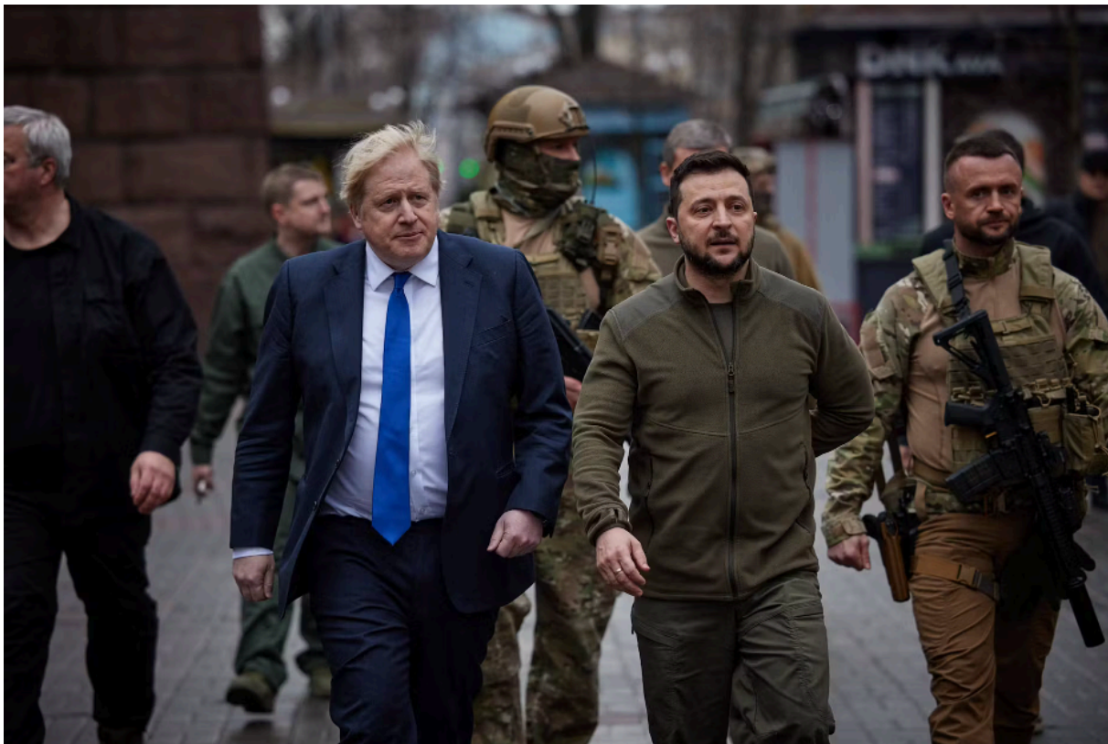
Установлению мира помешали - Борис Джонсон и Владимир Зеленский в апреле 2022 г.