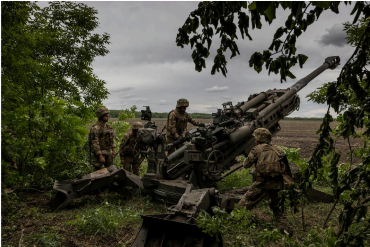
▲ Ukrainian soldiers prepare to fire an M777 howitzer at Russian forces in the Donetsk region.

Информационное агентство Исламской Республики, 12 декабря 2025 года