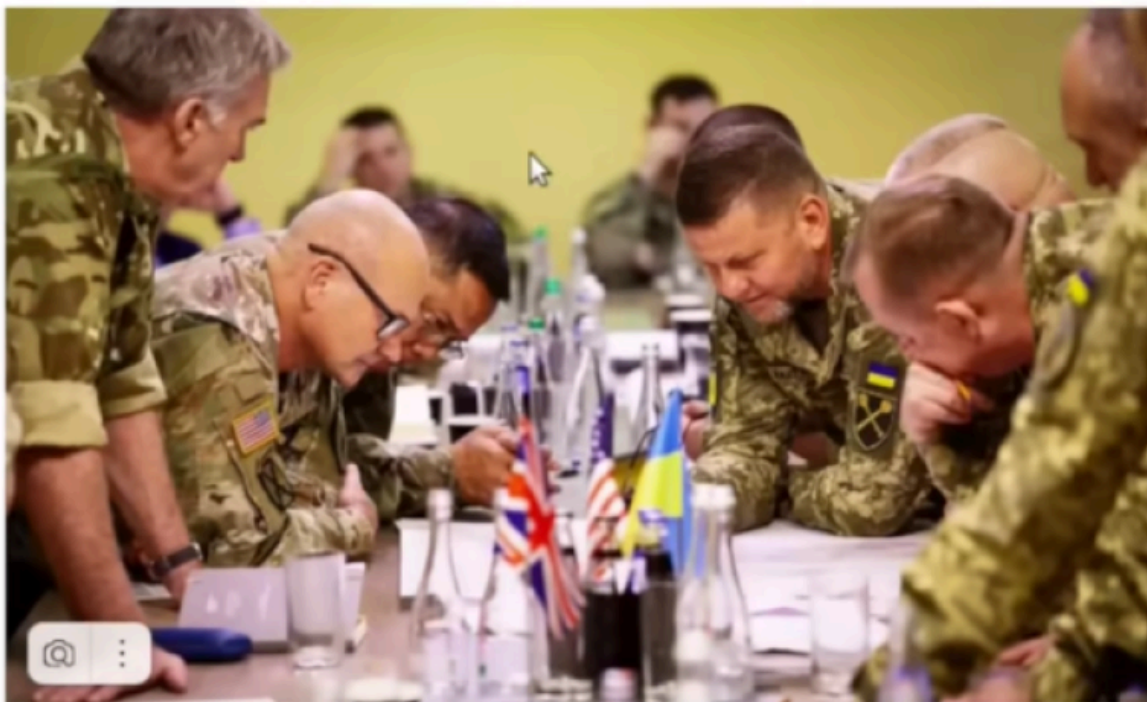
Ukrainian, American and British military leaders during a meeting in Ukraine in August 2023. Valerii Zaluzhnyi

В 2014 году Соединённые Штаты свергли избранное правительство Украины. Они привели к власти лояльный им режим. ЦРУ, согласно New York Times , взяло под контроль все украинские спецслужбы. Мы помним, что США совместно с НАТО в период с 2014 по 2022 год проводили реорганизацию и подготовку украинской армии. В частности, есть статья New York Times «Секретная история войны в Украине», в которой рассказывается о том, как США ведут всю войну против России из Висбадена в Германии.