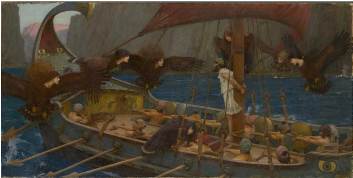
Джон Уильям Уотерхаус, «Улисс и сирены», 1891 год

Если этот государственный медиа-портал представляет ситуацию таким образом, то, на наш взгляд, это обусловлено политическими причинами. Учитывая угрожающую ситуацию в мире, российская внешняя политика явно стремится