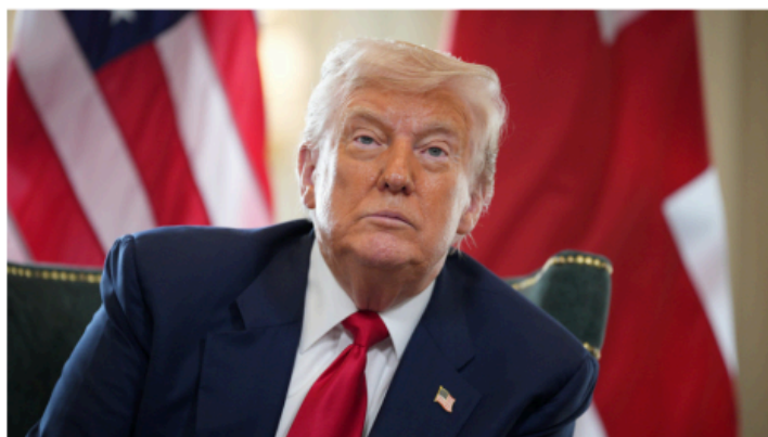
US President Donald Trump

The new National Security Strategy calls for a swift end to the Ukraine conflict and preventing further escalation in Europe