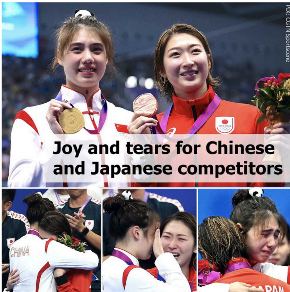
Японская пловчиха Рикако Ики (справа, красная майка) и китайская пловчиха Чжан Юфэй (слева, белая майка).

Японка Рикако Икее с юности была пловчихой мирового класса, но заболела лейкемией и несколько месяцев находилась в больнице. И вот она снова вернулась в спорт. Заплыв на 50 метров был последним соревнованием по плаванию на Играх в Ханчжоу и последним шансом Икее завоевать индивидуальную медаль, что она и сделала. Посыл был очевиден: лейкемия осталась в прошлом, и я снова в числе призеров! Китайка Чжан Юфэй была в курсе всей этой истории. Хотя они и были спортивными соперниками, они были азиатскими соседями и друзьями, прошедшими один путь. Это был эмоциональный момент. "Я сказала Рикако: Не плачь, не плачь", - вспоминает китайская пловчиха Юфэй. "Когда объявили ее имя на пьедестале почета, мне захотелось заплакать. Но я подумала: "Это прямая трансляция, я не могу плакать". Потом я увидела, как она плачет и обнимает своего тренера. Я больше не могла сдерживать слезы".