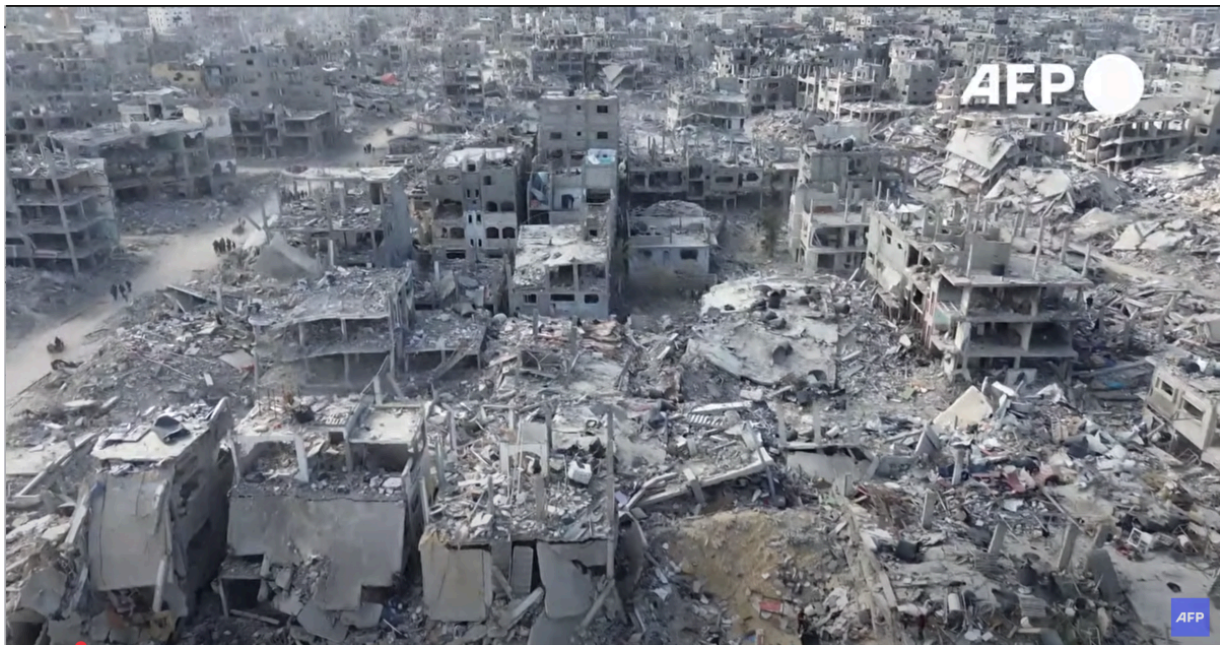
Рафах сегодня

Штроп задокументировал результаты подавления восстания и систематического уничтожения гетто в официальном отчете под названием «В Варшаве больше нет еврейского жилого района!» и направил его Гиммлеру.