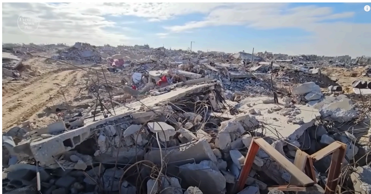
Скриншот из видео CBS от 15 июля 2025 года

Нынешние действия Израиля против населения Газы и Западного берега выглядят почти точной копией описанных выше действий нацистской Германии против населения Варшавы и Ленинграда.