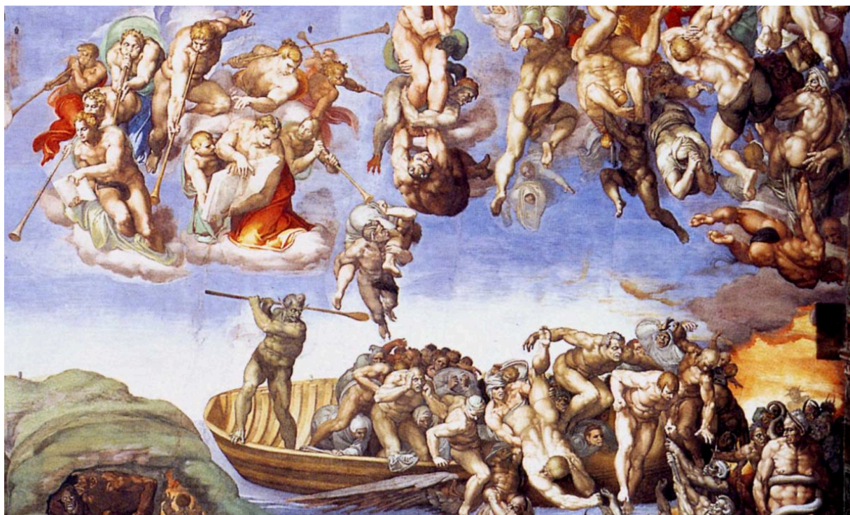
Микеланджело Буонарроти: Страшный суд – фреска в Сикстинской капелле в Ватикане, 1536-1541