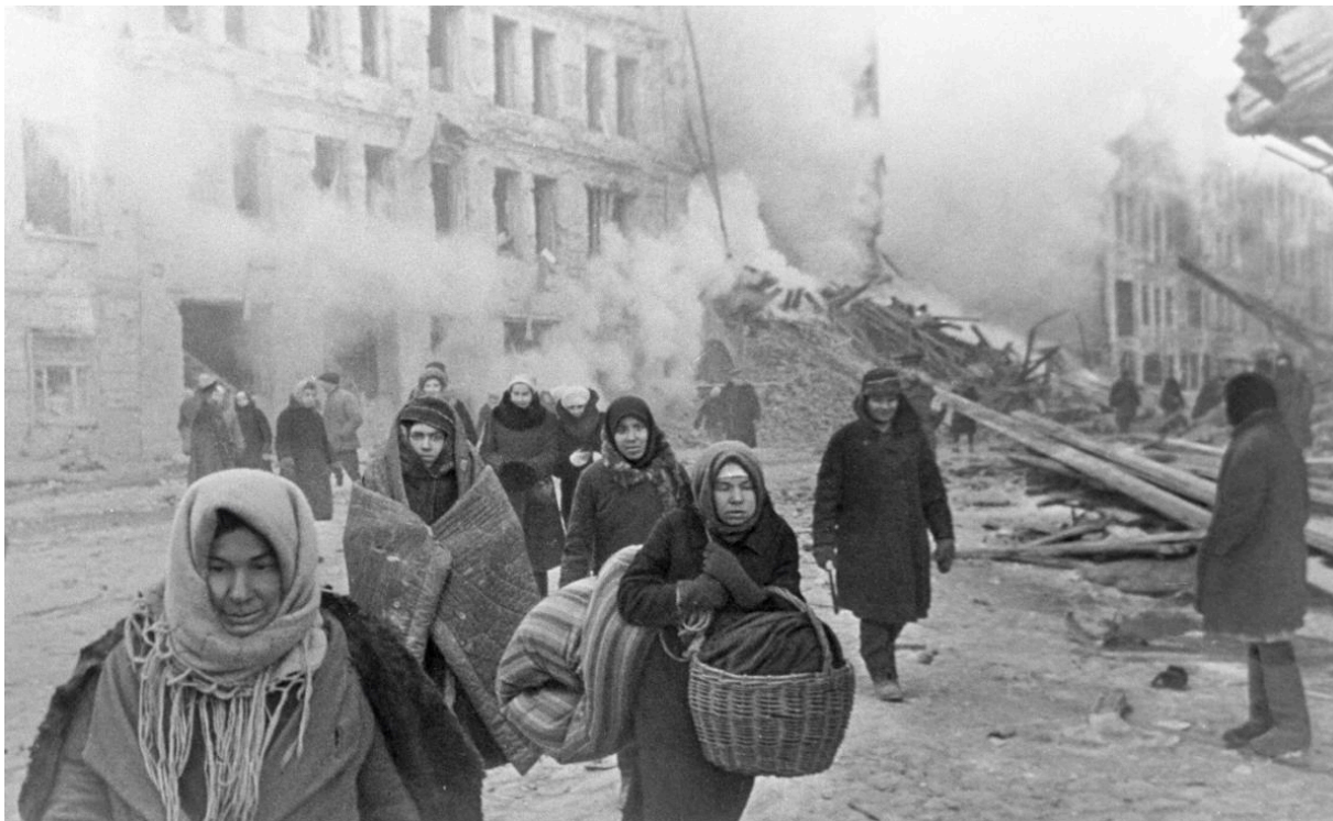
Жители Ленинграда покидают свои разрушенные дома, декабрь 1942 г.