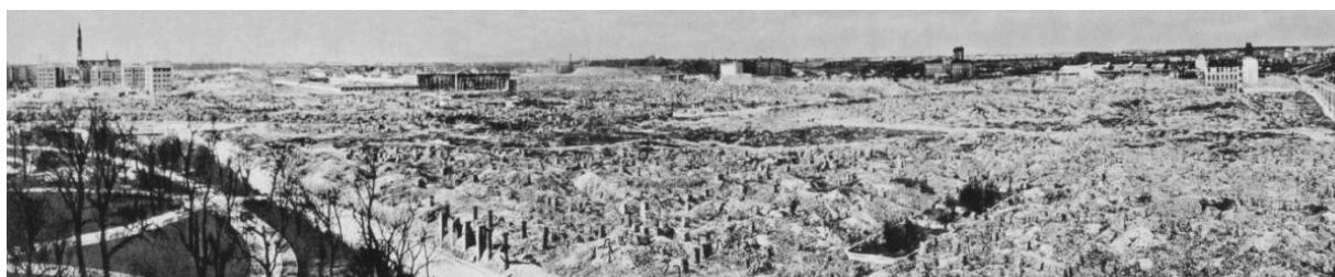
Варшавское гетто после разрушения:

https://de.wikipedia.org/wiki/Warschauer_Ghetto#/media/Datei:Warsaw_Ghetto_destroyed_by_Germans,_1945.jpg