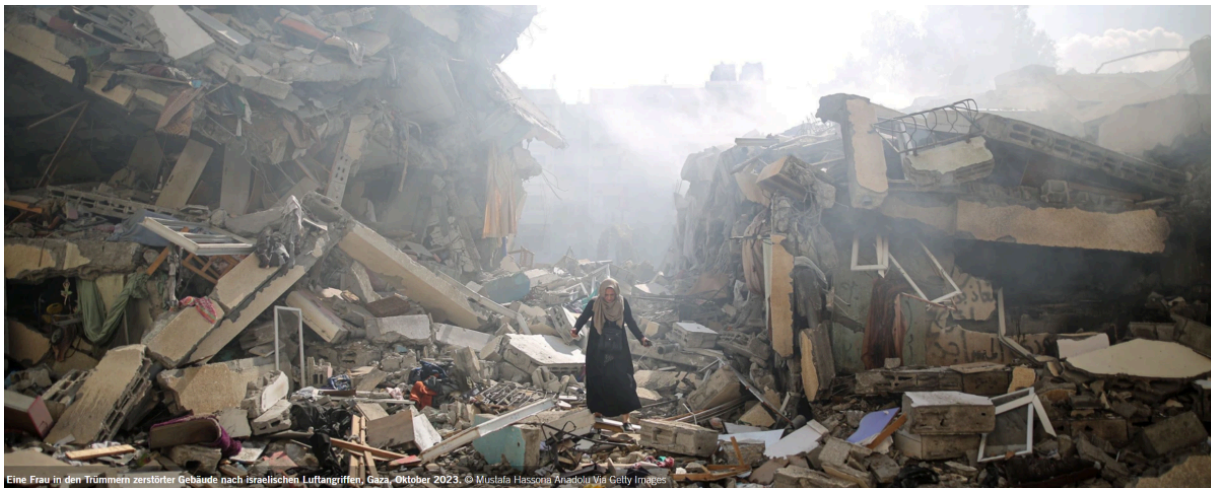
Женщина среди руин разрушенных зданий после израильских авиаударов, Газа, октябрь 2023 года.

Это напоминает письмо начальника СС-безопасности Рейнхарда Гейдриха от 20 октября 1941 года Генриху Гиммлеру, в котором он жаловался на неэффективность немецкого обстрела Варшавы и Ленинграда и напоминал рейхсфюреру СС о распоряжении Адольфа Гитлера об «уничтожении» этих городов: