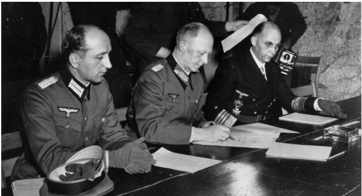
7 мая в штабе генерала Дуайта Д. Эйзенхауэра в Реймсе генерал Альфред Йодль подписал акт о капитуляции в сопровождении Вильгельма Оксенюса (слева) из Люфтваффе и Ганса-Георга фон Фридебурга, представителя германского военно-морского флота.

7 мая 1945 года: немцы подписывают капитуляцию перед американцами.