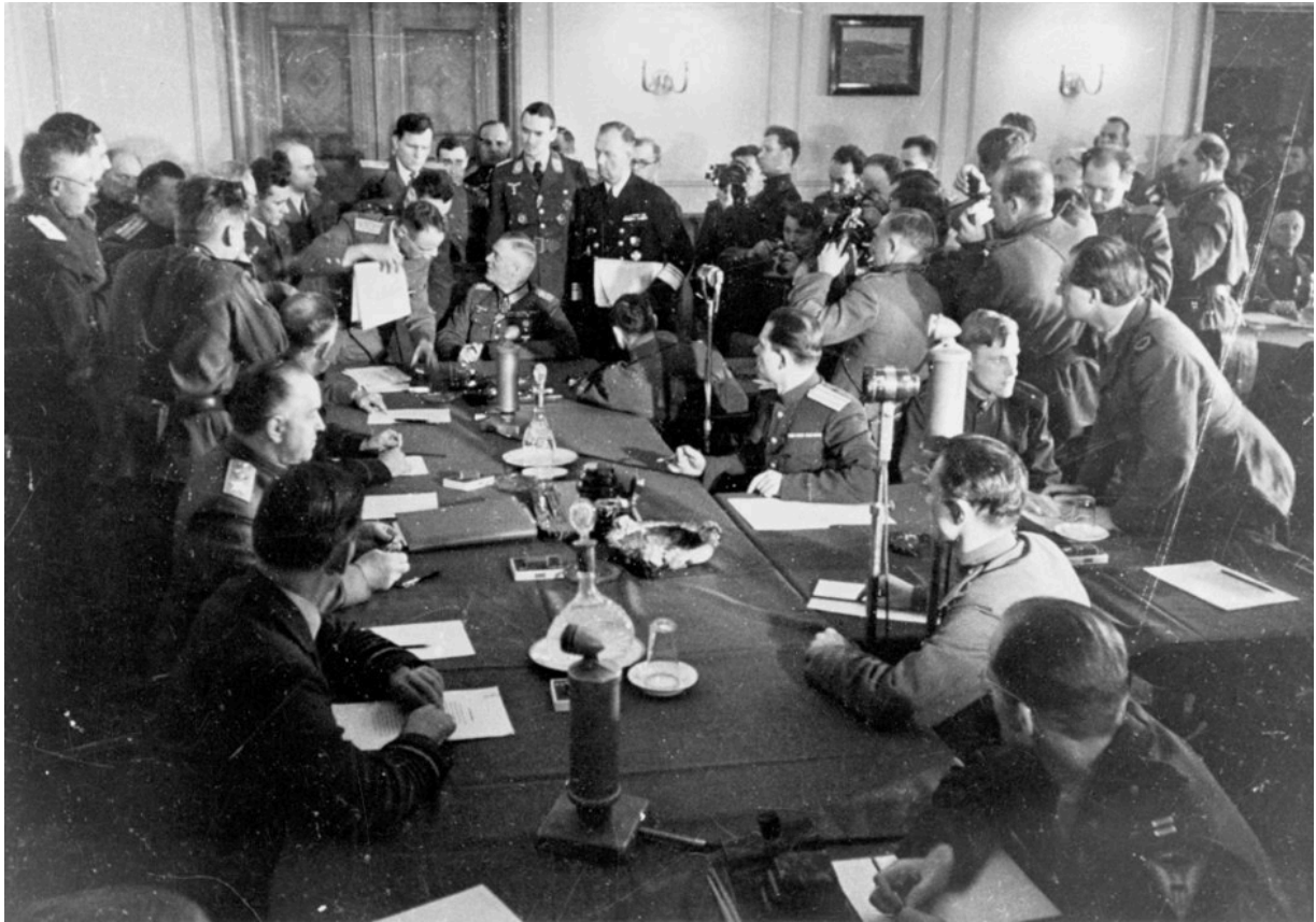
Фотографы документируют подписание акта о капитуляции фельдмаршалом Кейтелем, Берлин-Карлсхорст, 9 мая 1945 г.

8 мая (9 мая в России) 1945 года: немцы капитулируют и подписывают советские условия в Берлине-Карлсхорсте.