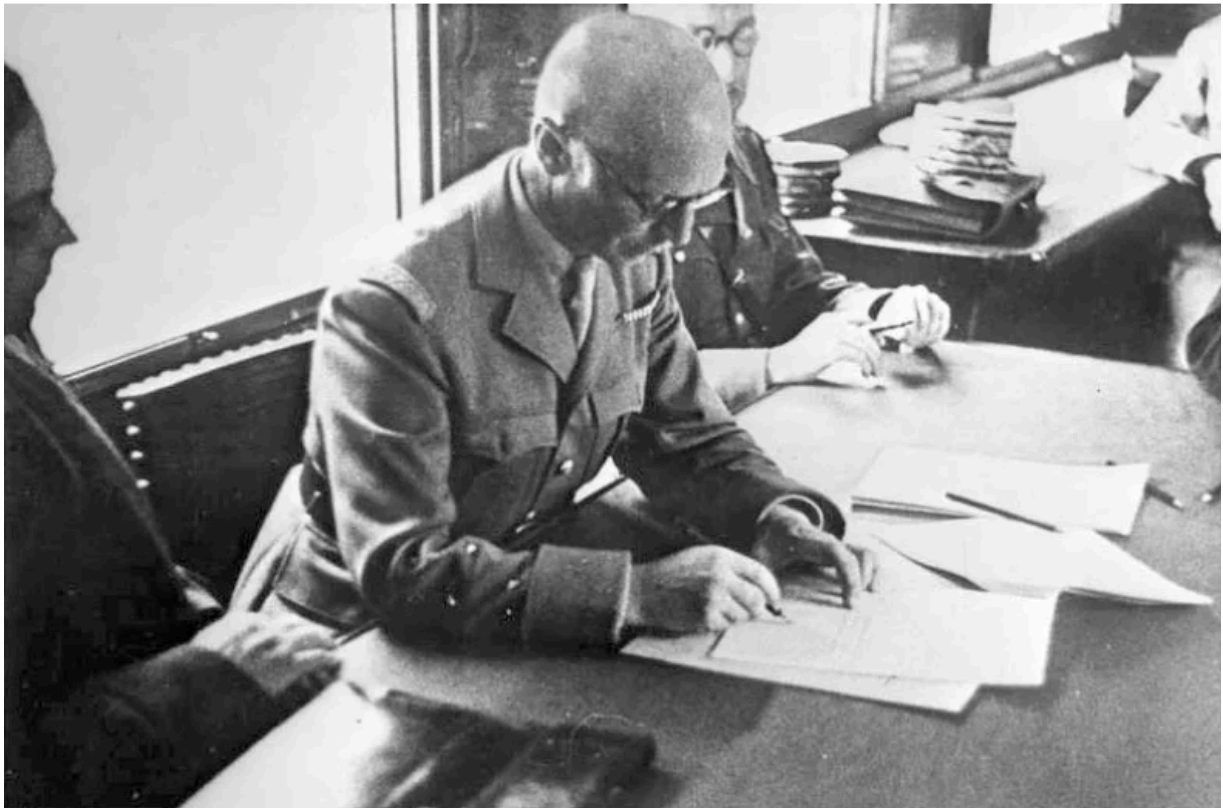
Французский генерал Шарль Ханцигер при подписании документов о капитуляции недалеко от Компьень, Франция, 22 июня 1940 года.

7 мая 1945 года: немцы подписывают капитуляцию перед американцами.