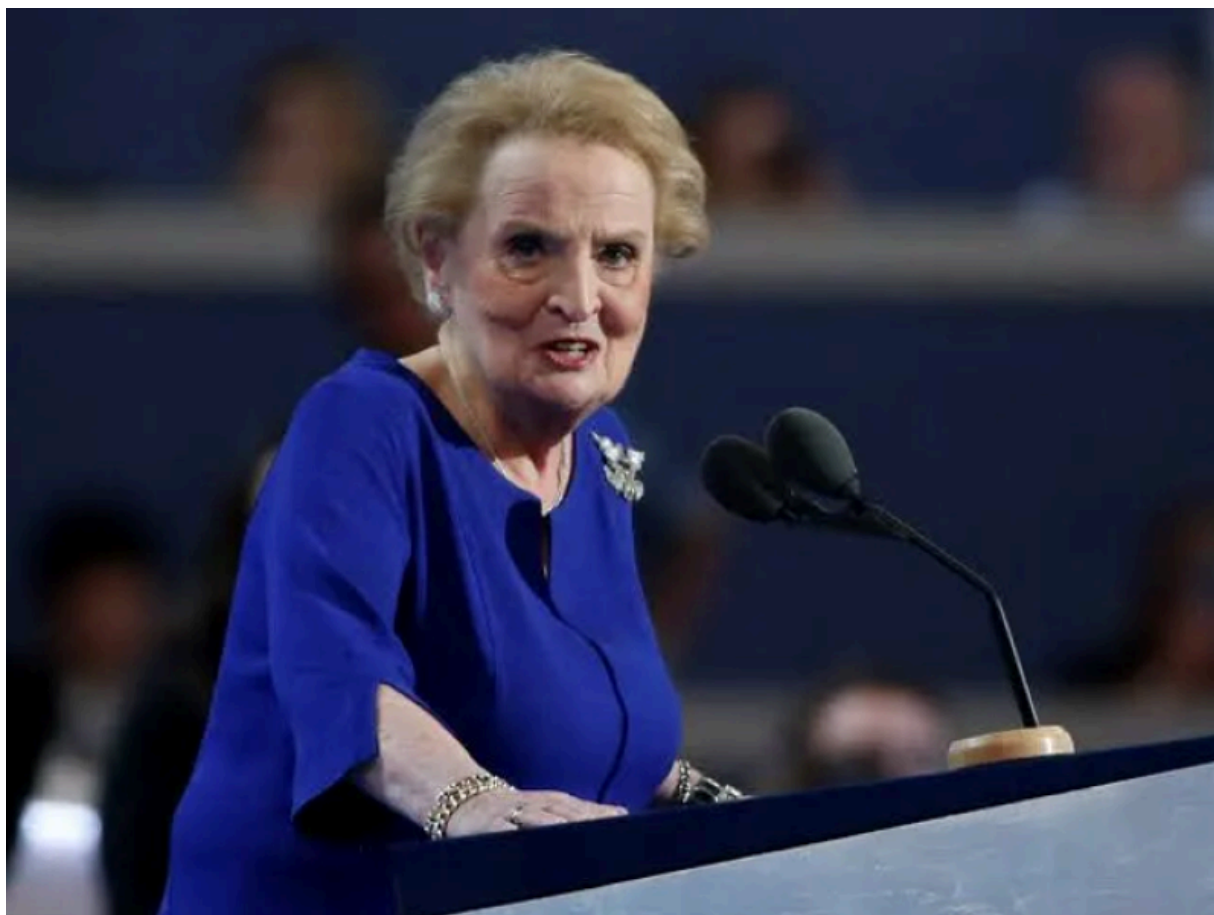
Олицетворение зла: Мадлен Олбрайт

Когда мы говорим о зле, я лично считаю, что в исключительных случаях вполне допустимо плохо отзываться о мертвых; Олбрайт умерла в 2022 году.