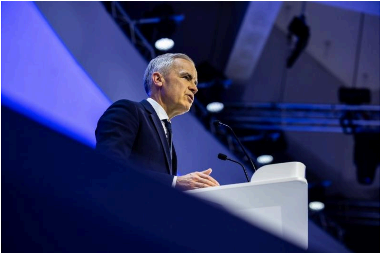
Премьер-министр Канады Марк Карни во время своего специального выступления в Давосе 20 января 2026 года.

мы называем международным порядком, основанным на правилах. Мы присоединились к его институтам, — сказал Карни, — мы хвалили его принципы, мы извлекали выгоду из его предсказуемости. И благодаря этому мы могли проводить внешнюю политику, основанную на ценностях, под его защитой».