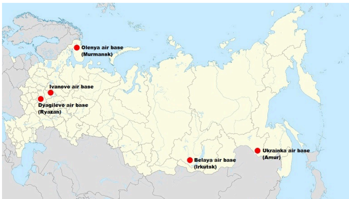
Карта аэропортов, подвергшихся атакам