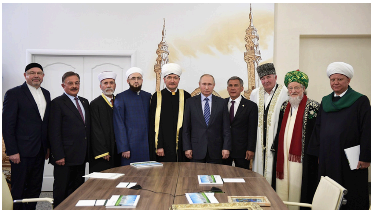
Встреча президента Путина с лидерами мусульманской общины России

К радости американских стратегов, Навальный также развалит Россию, лишь бы помочь Америке снова стать великой и сделать, вероятно, сильно ущемленную, белую супремацистскую Россию неактуальной на международной арене, в то время как Путин работает над тем, чтобы мультикультурная Россия, самая большая и богатая ресурсами страна в мире, охватывающая 11 часовых поясов и включающая в себя 200 национальных и/или этнических групп, была единой и боролась с исламофобией и другими формами расизма и разобщения.