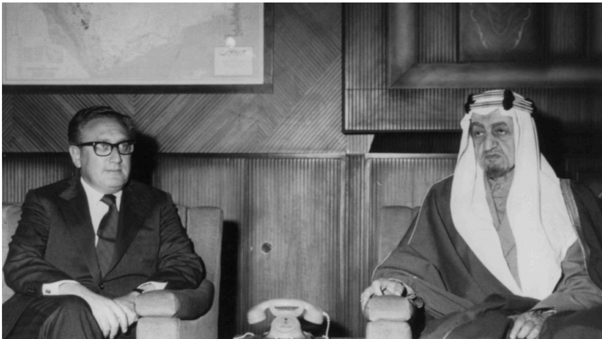
Генри Киссинджер с королем Фейсалом, 1973 год, Источник: Библиотека Конгресса США

Это основные причины, по которым Лига арабских государств так и не смогла проявить себя, поскольку она не смогла занять четкую линию в интересах этого сообщества и, таким образом, вплоть до сегодняшнего дня не смогла реализовать свой потенциал из-за концепции дестабилизации, предпринятой США на Ближнем Востоке.