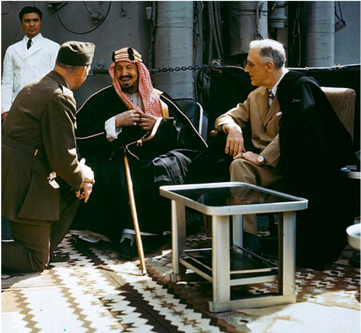
Король Ибн Сауд и президент Рузвельт, 1945 г.

Вторым важным событием стали переговоры Генри Киссинджера в 1973 году, когда он снова пообещал военную защиту, а взамен получил обещание, что саудовцы будут продавать свою нефть исключительно в долларах США и вкладывать вырученные средства в американские облигации. Так родился нефtedоллар, и доминирование Америки было обеспечено на следующие 50 лет.