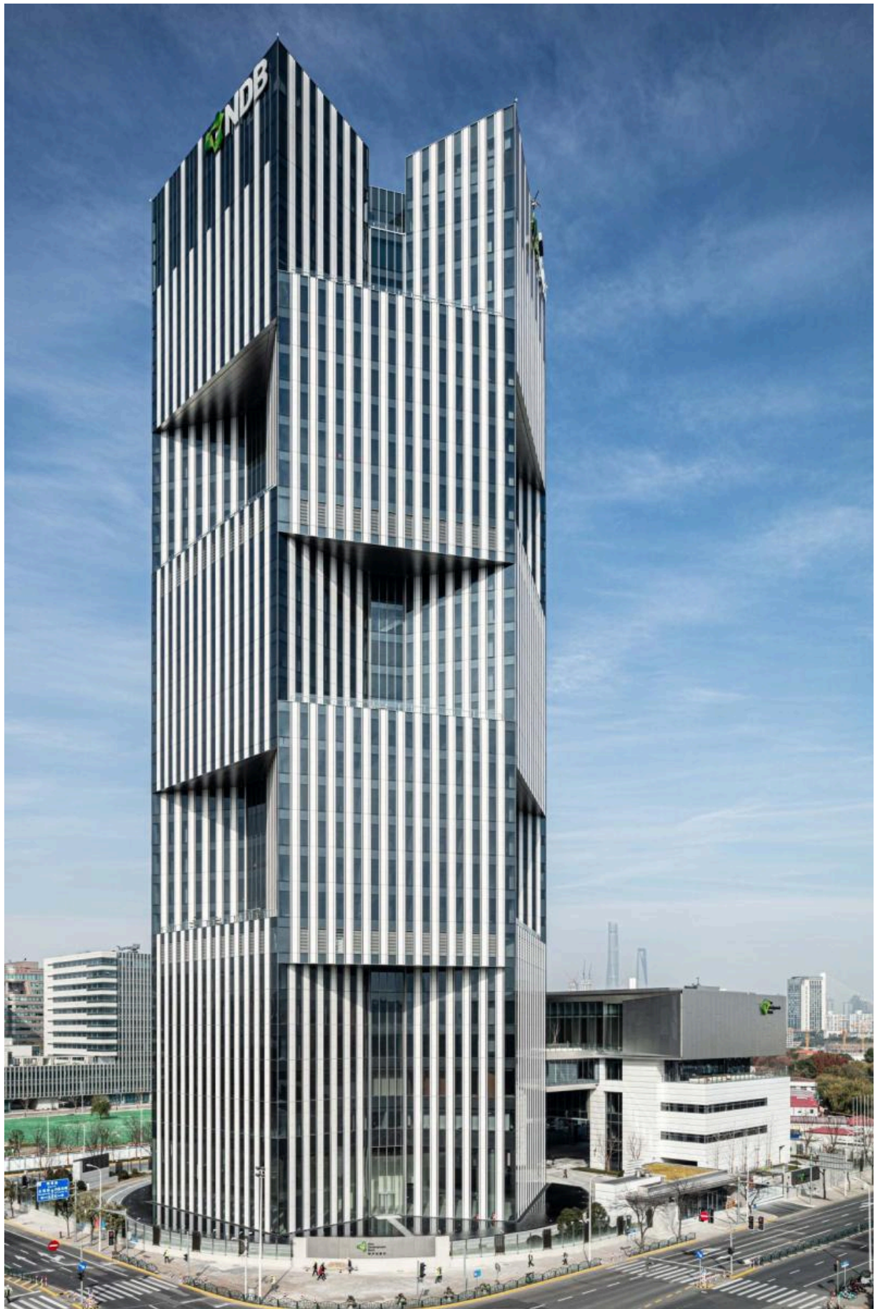
Штаб-квартира Нового банка развития в Шанхае