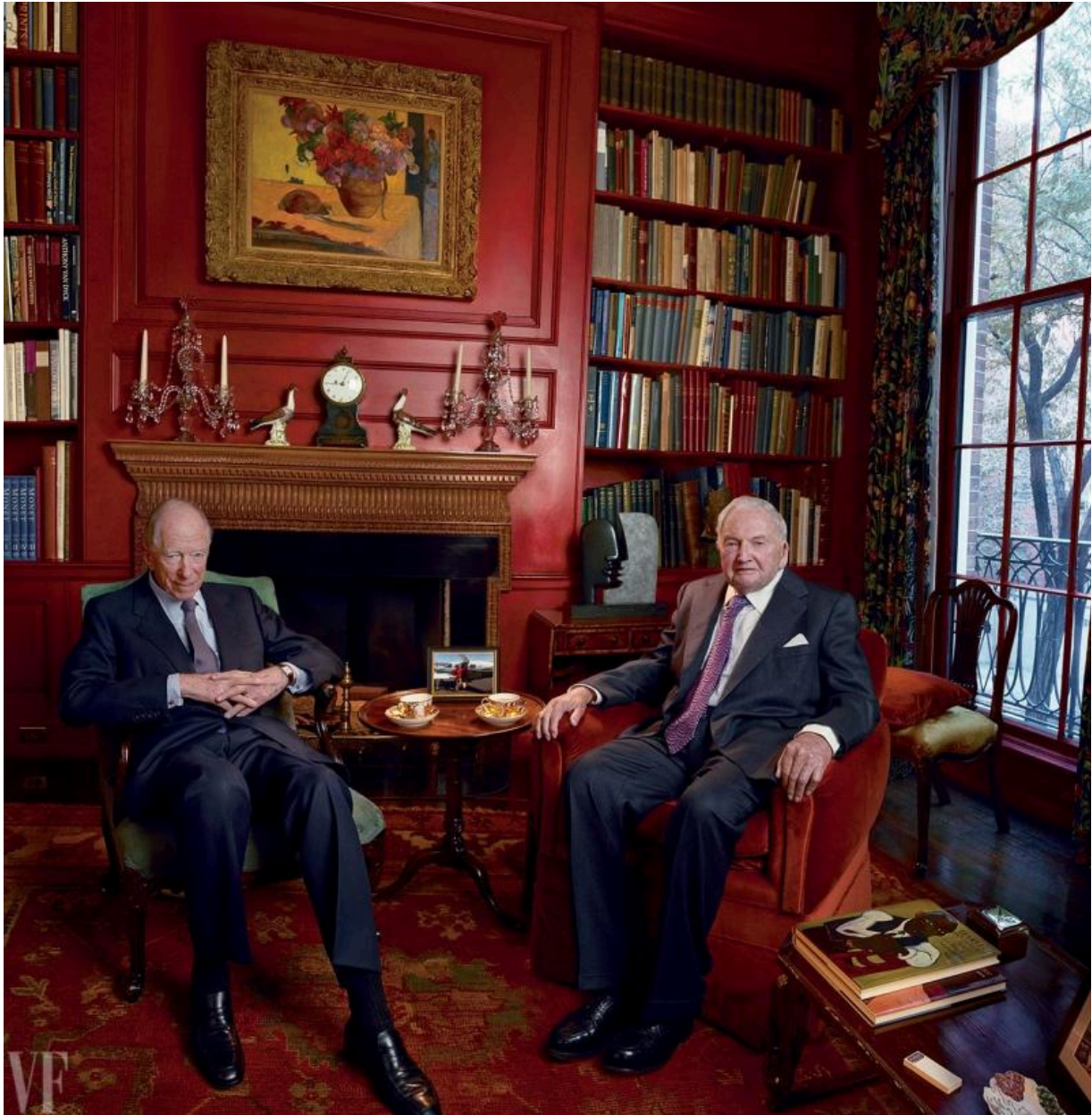
Филантропы наедине с собой: Лорд Джейкоб Ротшильд и Дэвид Рокфеллер в библиотеке городского особняка Дэвида Рокфеллера в Нью-Йорке, май 2012 г.

Одними из главных движущих сил этого развития были, в частности, эти два господина: