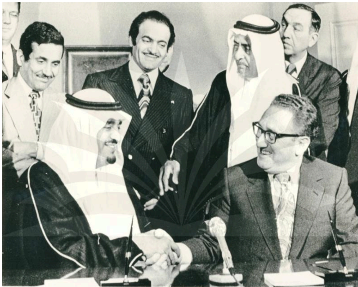
Генри Киссинджер и принц Фахд из Саудовской Аравии 8 июня 1974 года в Вашингтоне

В этом контексте нельзя не упомянуть о нефtedолларе. После того как 8 июня 1974 года Саудовская Аравия пообещала США, что торговля нефтью в Западной Азии будет вестись исключительно в долларах, все страны мира, нуждавшиеся в нефти для обеспечения своих энергетических потребностей, были вынуждены сначала приобретать доллары, чтобы иметь возможность покупать нефть. Таким образом, до сих пор в значительной степени обеспечивается кредитоспособность США как страны-должника.