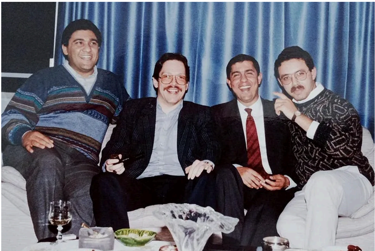
Отдых после рабочего дня коллег мусульман и коптов (христиан) в Каире, ставших отличной и успешной командой.

Я жил в Египте и неоднократно бывал в большинстве мусульманских стран. В Египте, Индонезии, Ливане и Объединенных Арабских Эмиратах также существуют крупные христианские общины, насчитывающие миллионы граждан. Несмотря на трудности сосуществования, христианским меньшинствам в этих странах удастся уживаться. А в том, что касается мультикультурной толерантности, Малайзия сегодня, несомненно, является ярким примером для всех.