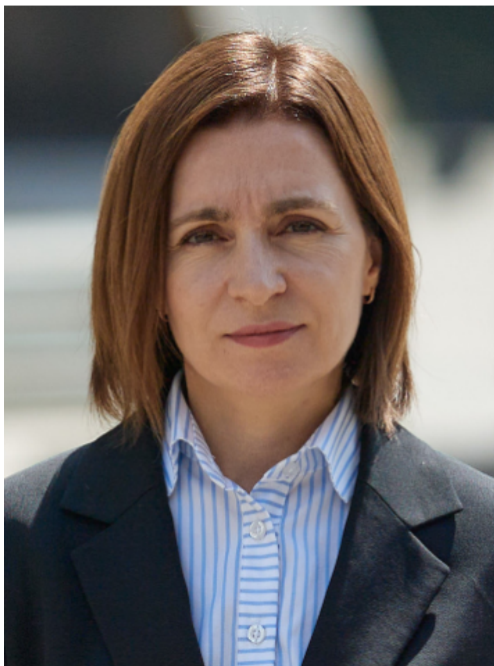
Майя Санду - президент Молдавии

С приходом к власти Майя Санду произошло дальнейшее сближение с Западом. В результате Майя Санду попыталась уничтожить всю оппозицию. Оппозиция и значительная часть населения (80% молдаван говорят по-русски) заинтересованы в дружественных, нормальных отношениях с Россией, а гражданка Румынии Майя Санду - нет.