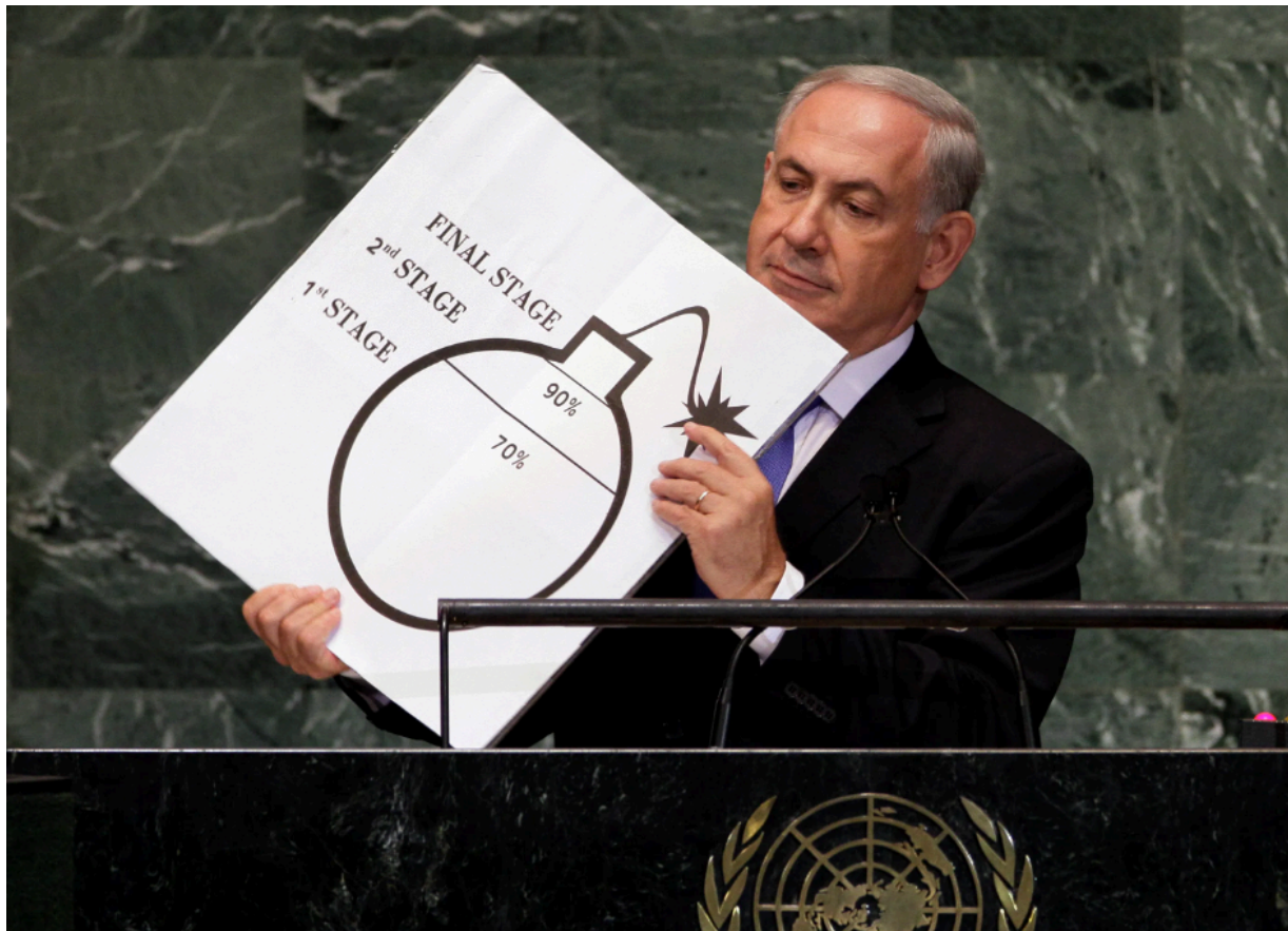
Типичный Нетаньяху - поджигатели войны в ООН за работой - 2012

Нетаньяху лично заинтересован в том, чтобы этот кризис перерос в полномасштабную войну.