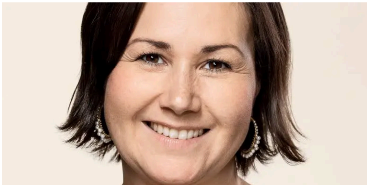
Ая Хемниц – член парламента Гренландии

Ая Хемниц, с 2015 года член парламента от партии «Инуит Атакатигиит» в Гренландии, придерживается другого мнения и протестует: