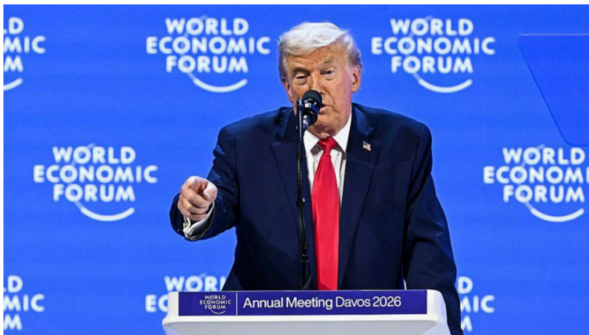
Президент Трамп, ВЭФ, Давос, 21 января 2016 года

До 21 января Трамп заявлял, что «мир не будет безопасен, если мы не будем иметь полный и абсолютный контроль над Гренландией». В своей речи в Давосе 21 января он объявил, что «мы [НАТО] никогда ничего не хотели и никогда ничего не получали» — все, что хотят Соединенные Штаты, — это место под названием Гренландия. Далее он заявил: «Я не должен применять силу. Я не хочу применять силу. Я не буду применять силу» (I don't have to use force. I don't want to use force. I won't use force).