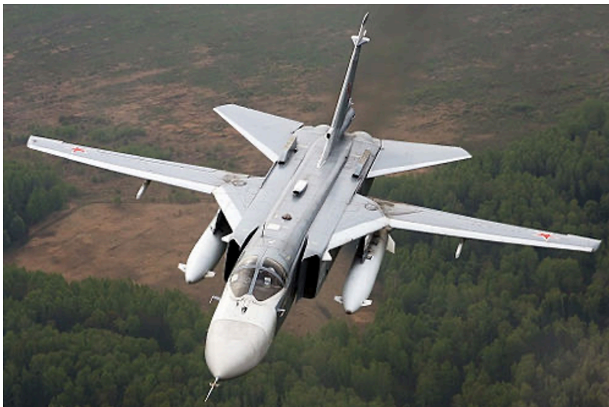
Sukchoi – SU-24

У украинцев их осталось не так уж и много - всего несколько [менее 10].