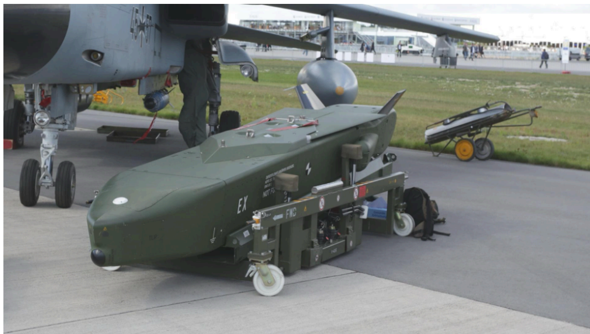
Таурус (Крылатая ракета)