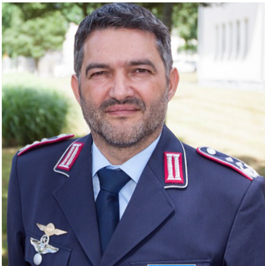
Франц Грефе - бригадный генерал

Два сотрудника - Фенске и Флорштедт (точное написание неизвестно)