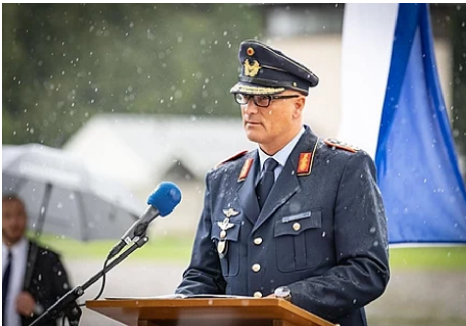
Генерал-лейтенант Инго Герхарц