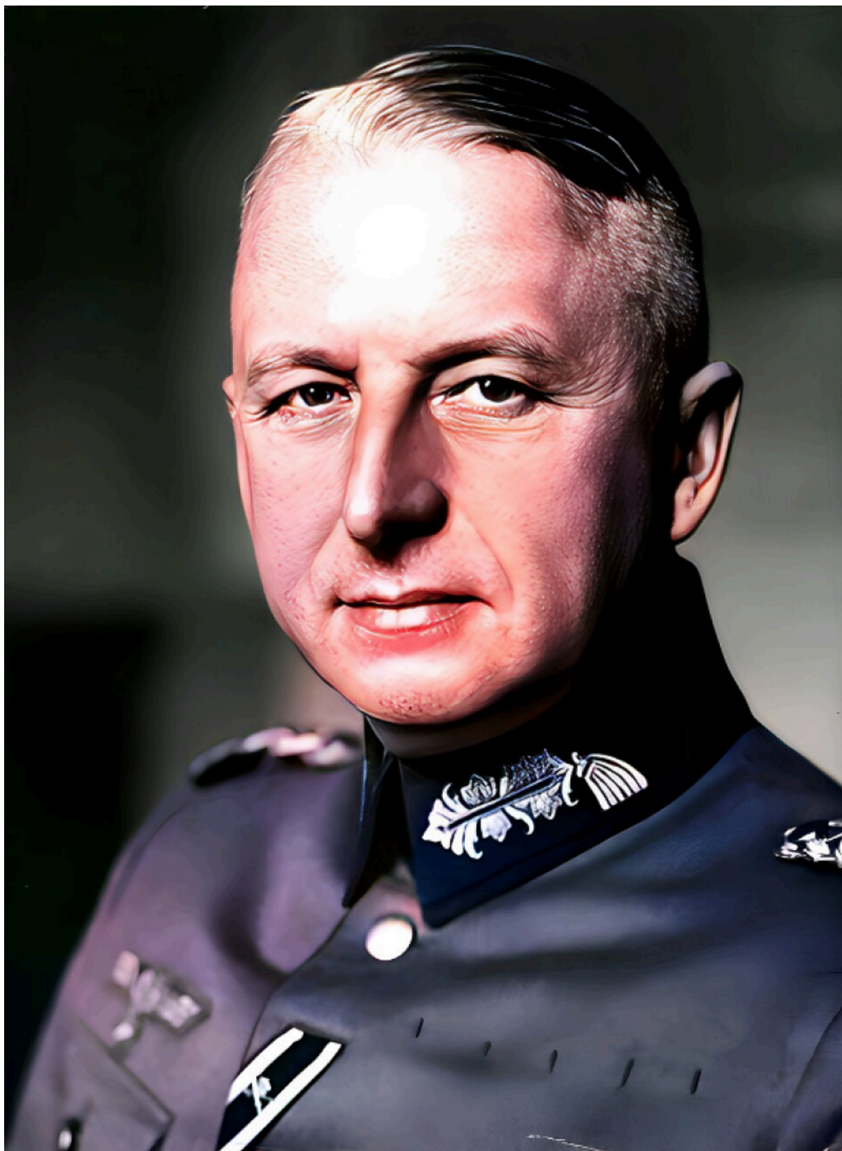
Военный преступник, которого превратили в героя и который участвовал в создании современного Бундесвера — Эрих фон Манштейн.

Доктор Олендорф дал следующие показания: айнзацгруппы были не просто прикреплены к армейским группам, но и подчинялись им. Офицеры подразделений "палачей" направлялись в командный состав Манштейна для координации массовых убийств вместе с другими офицерами. В своих показаниях Олендорф,