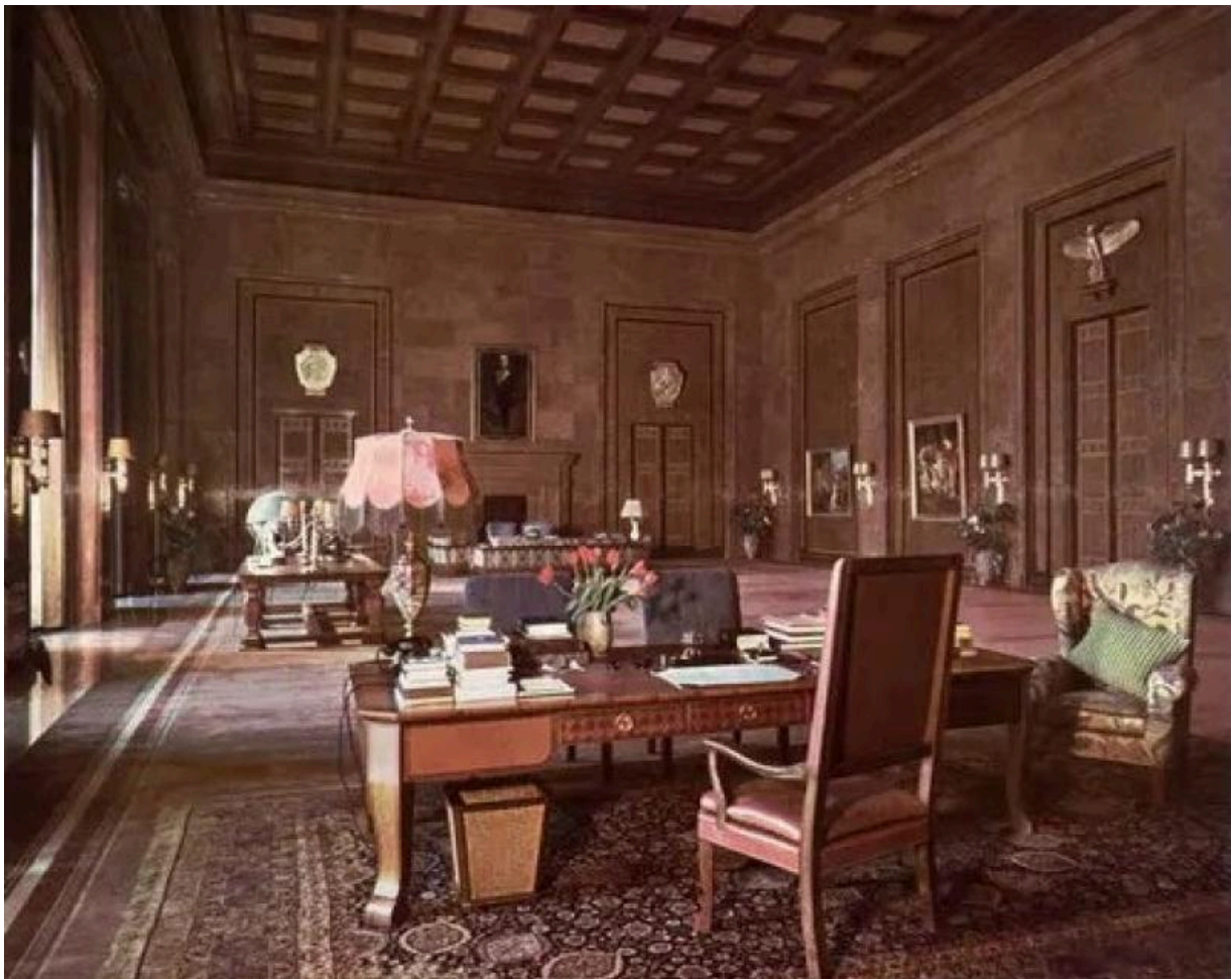
Кабинет Гитлера в Рейхсканцелярии — помпезно

Дискуссия в Германии о Гитлере так и не вышла за рамки описания «чудовища». Было удобнее замять это «чудовище» и уничтожить все, что с ним было связано. Если бы Оберзальцберг и Рейхсканцелярия до сих пор стояли, немцы, вероятно, осознавали бы манию величия Гитлера — ничто в нём не было близким народу.