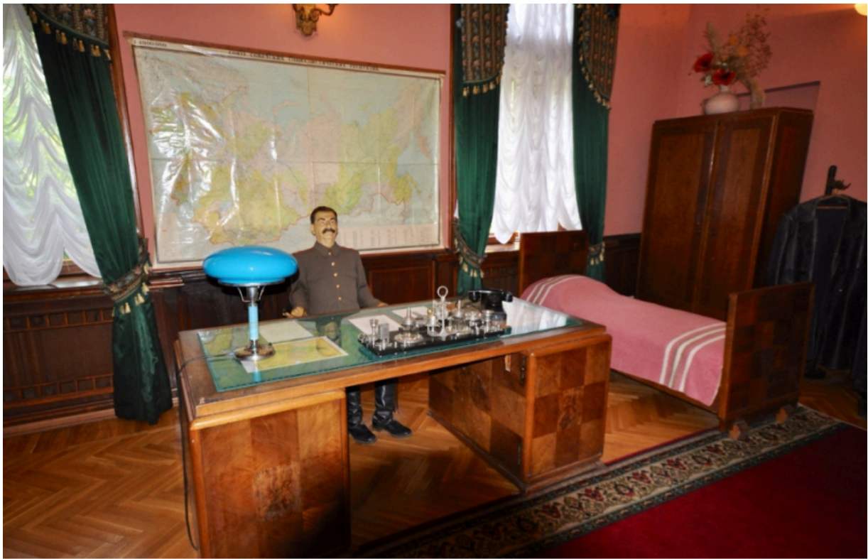
Рабочий кабинет на даче Сталина в Сочи.