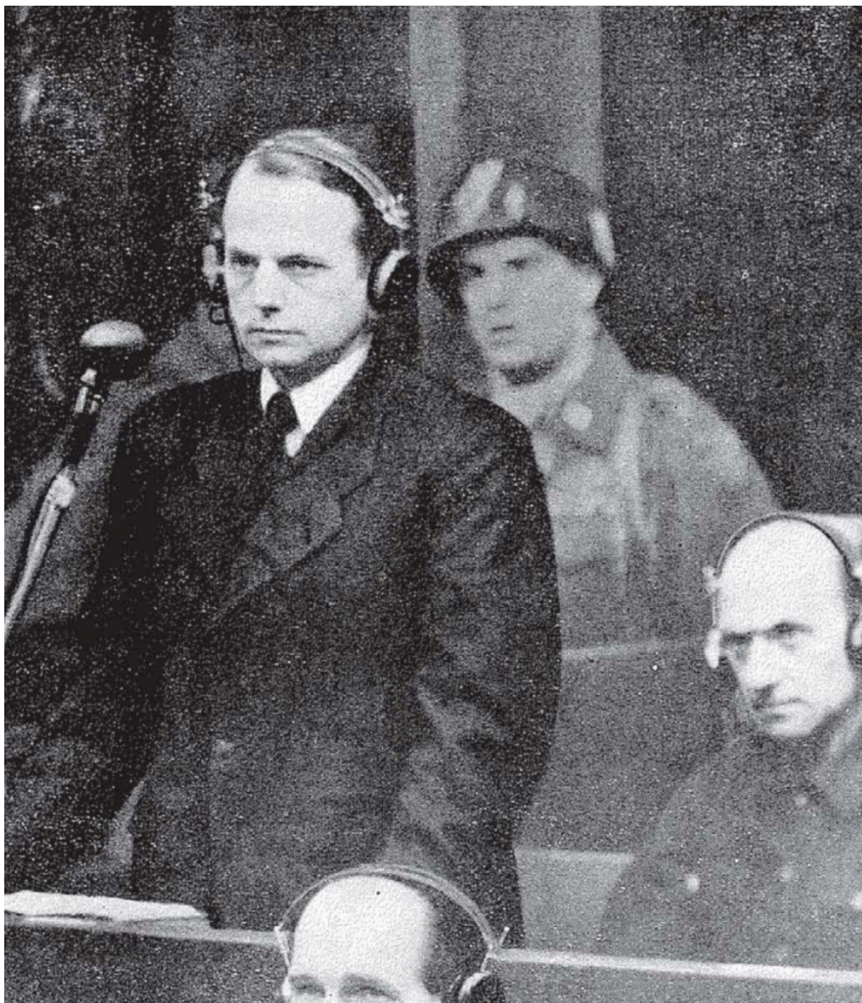
Отто Олендорф заявляет о своей невиновности

14 из них были приговорены к смертной казни, двое – к пожизненному заключению, а остальные – к тюремному заключению на срок от 10 до 20 лет. Однако последовательное суровое наказание преступников в ходе процесса над айнзатцгруппами так и не было приведено в исполнение: из 14 приговоренных к смертной казни были казнены только трое, в том числе Олендорф. Все остальные осужденные были освобождены в период с 1951 по 1958 год.