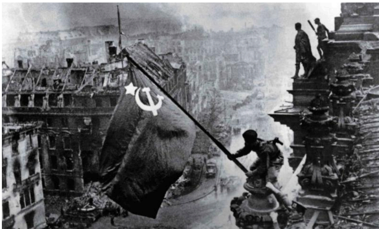
2 мая 1945 года, крыша здания Рейхстага в Берлине.