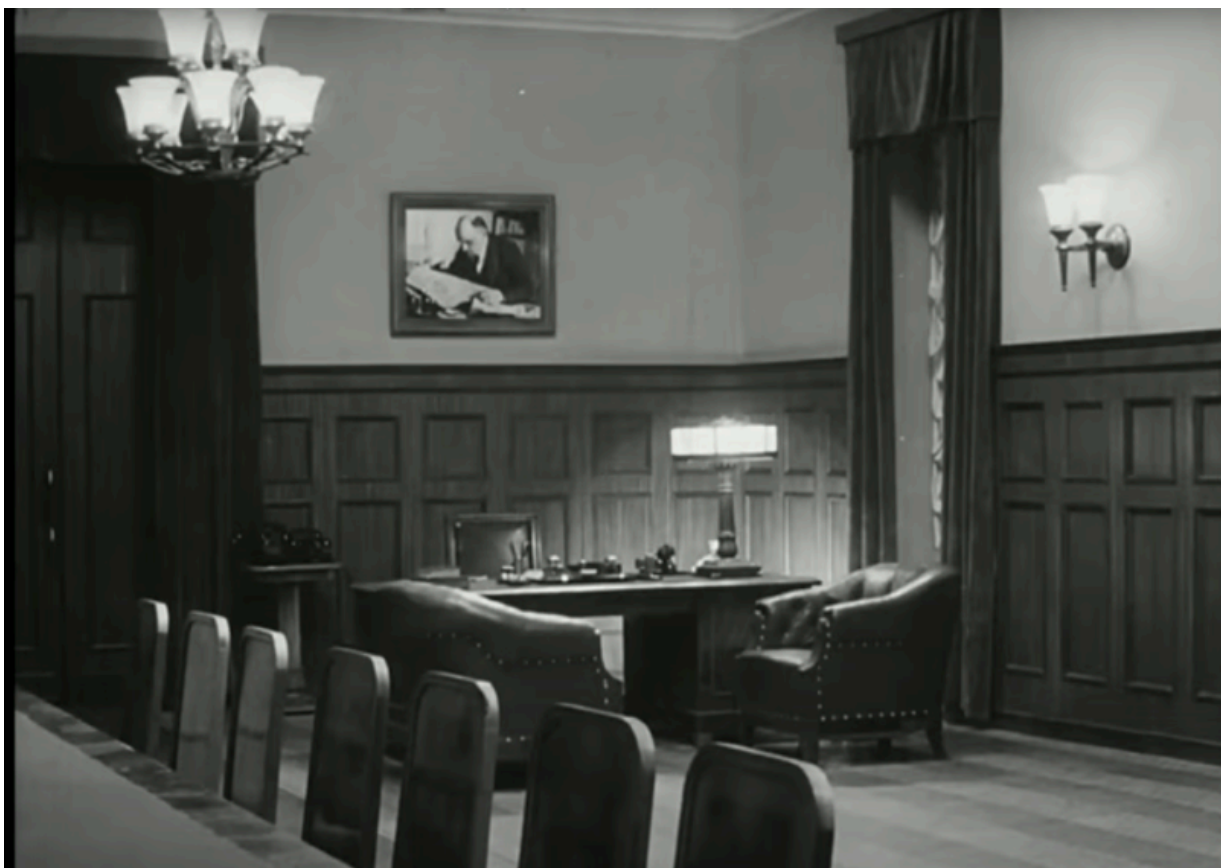
Рабочий кабинет Сталина в Кремле в 1941 году – кадр из видео

До мая 1945 года немцев обманывал Йозеф Геббельс, а затем обманывали другие. Как вся эта ложь практически разрушила историческое самосознание немцев, мы покажем на ряде примеров.