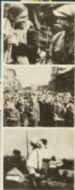
Киноафиша «Битва за Россию»

Distributed by 20 th CENTURY-FOX FOR THE WAR REPRESENTATIVE COMMITTEE — MOTION PICTURE INDUSTRY