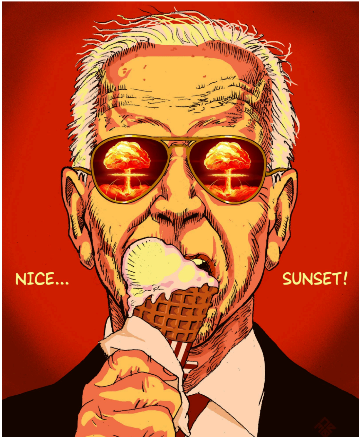
Джо Байден с мороженым в рожке

Ответ вытекает из американской директивы по планированию применения ядерного оружия (Nuclear Weapons Employment Planning Guidance). Это засекреченная директива, утверждаемая президентом США — в последний раз Джо Байденом весной 2024 года, — которая определяет, как Министерство обороны разрабатывает доктрины и варианты возможного применения ядерного оружия.