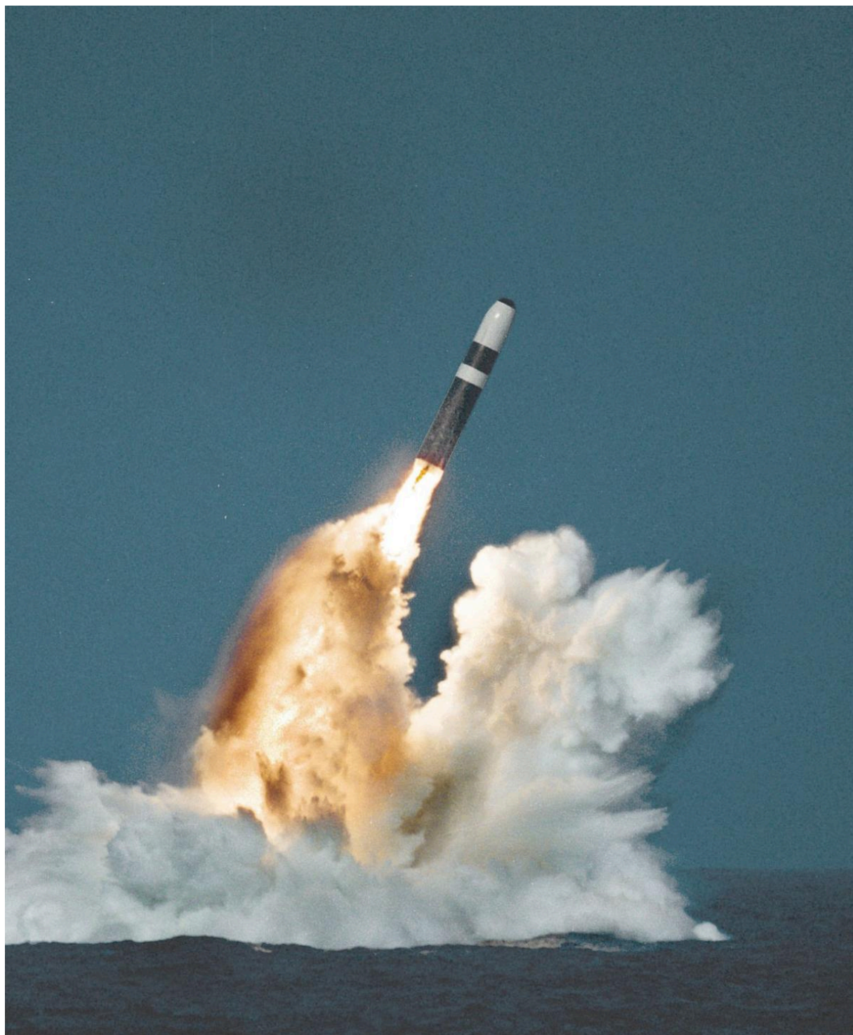
Trident II при запуске с погруженной подводной лодки

боеголовками (MIRV). Эти ракеты имеют дальность полета более 11 000 км и могут поражать несколько целей одновременно. Они оснащены твердым топливом, поэтому не требуют заправки перед запуском и всегда готовы к немедленному использованию.