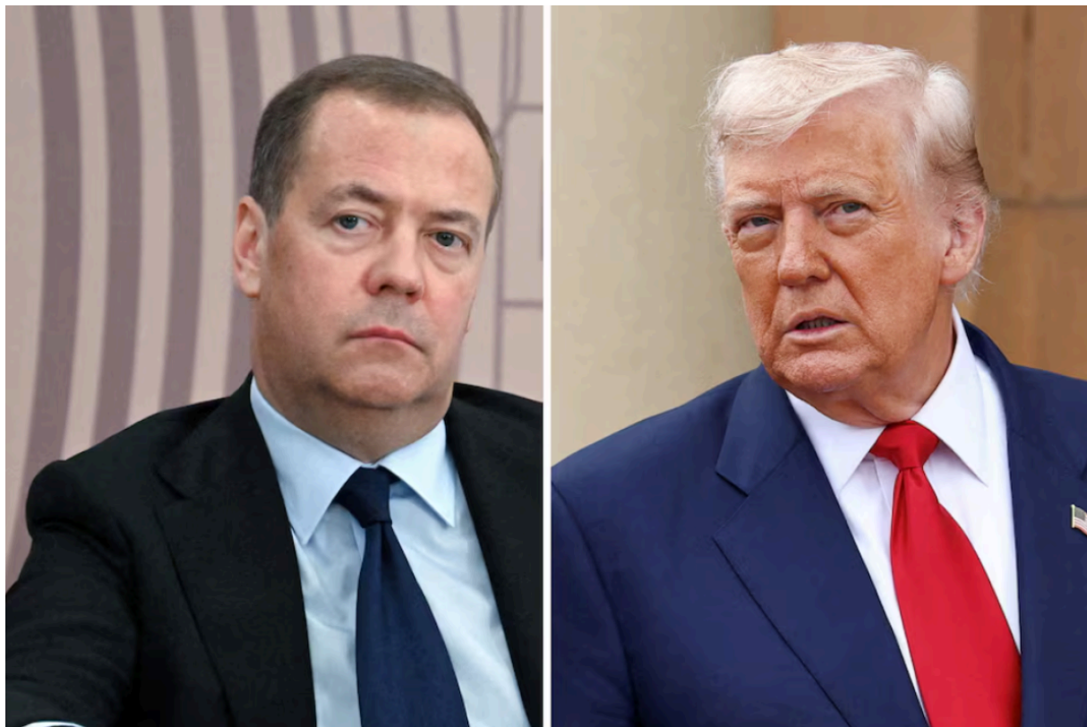
Медведев и Трамп; Sputnik/Алексей Майшев и REUTERS/Эвелин Хокштейн Purchase Licensing Rights

В рамках гибридной войны против России и тех, кого Дональд Трамп считает её сторонниками, он 30 июля 2025 года на платформе Truth Social объявил о введении с 1 августа 25-процентной импортной пошлины на товары из Индии. Среди прочего, это было обосновано закупками Индией российской энергии и вооружений. Одновременно он пригрозил введением вторичных санкций (secondary tariffs) в размере до 100% в случае, если Индия или другие страны продолжат импортировать российскую нефть — если только Россия не согласится на прекращение огня примерно до 8 августа.