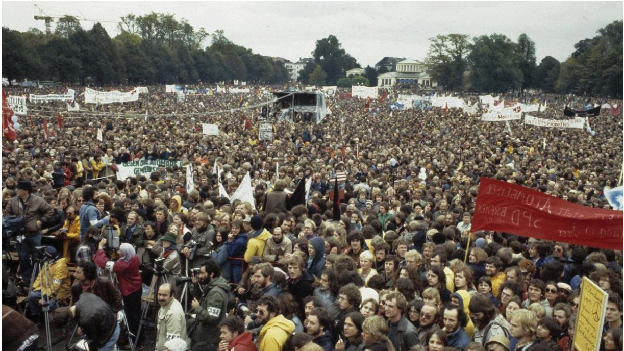
Массовая демонстрация 22 октября 1983 года в парке Хофгартен в Бонне

образовалась цепь протеста длиной около 108 км. Эти акции были мирными, но впечатляли своим масштабом.