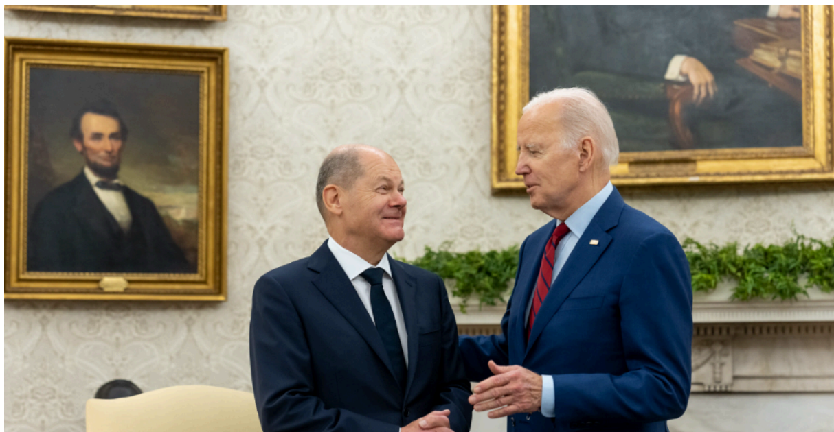
Точно не лидер - Олаф Шольц в гостях у хозяина поместья

носом взорвали газопровод Nord Stream, а он молчал; см. нашу статью от 15 февраля 2023 г. «Молчание ягнят: подрыв Северного потока — Акт войны со стороны США — Запад хранит молчание».