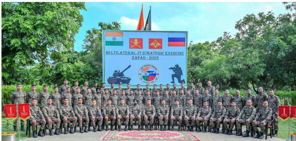
Индийский личный состав отправляется для участия в военных учениях «Запад-2025» — Вооружённые силы Индии, 9 сентября 2025 г.

Эти учения проводятся только раз в четыре года и в них участвуют сотни тысяч военнослужащих. В ответ на это Польша, по имеющимся данным, направила 40 000 военнослужащих к границе с Беларусью после проведения собственных учений в рамках подготовки к учениям «Запад».