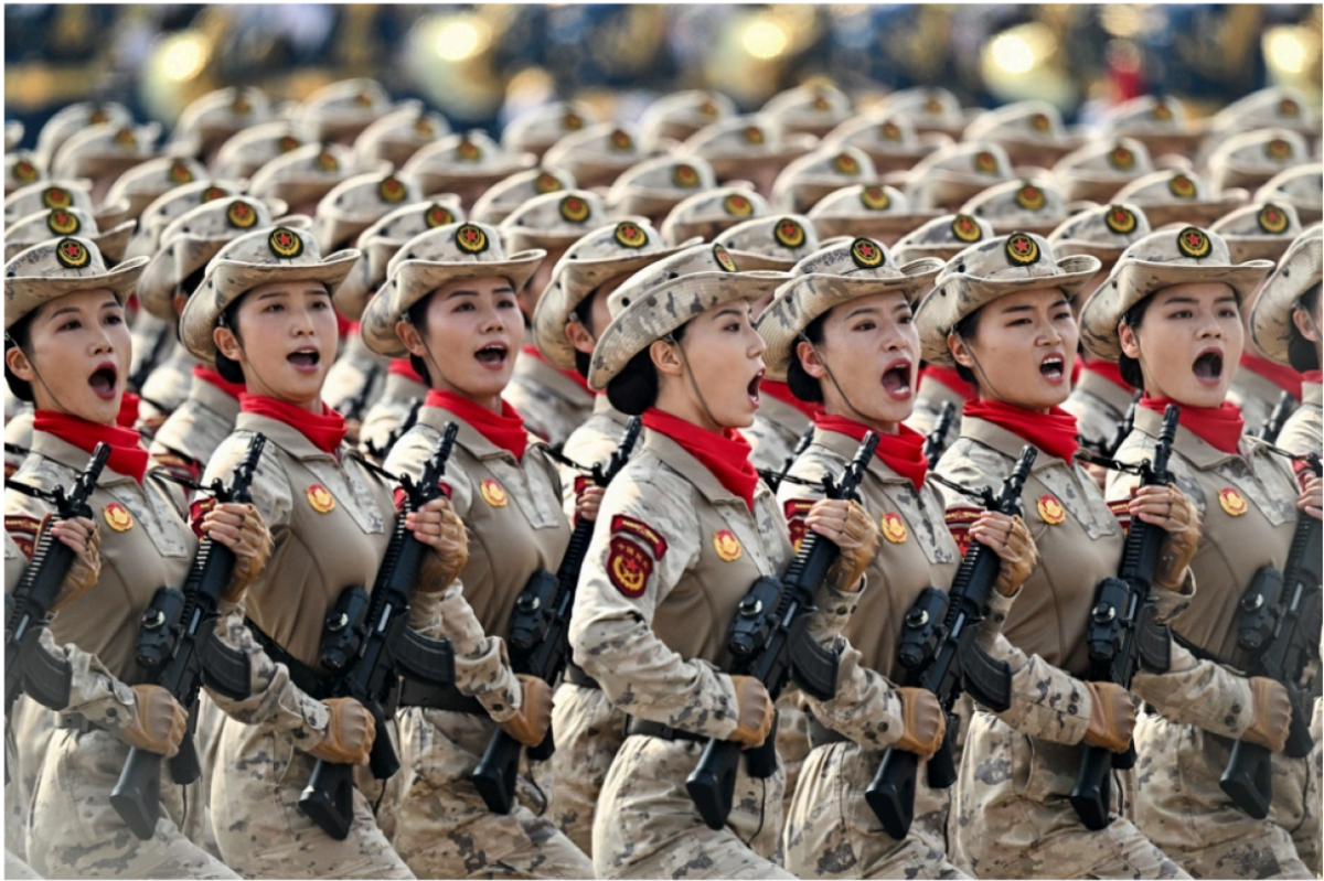
Chinese female troops march during a military parade marking the 80th anniversary of victory over Japan and the end of World War II, in Beijing's Tiananmen Square on September 3, 2025.

This marks a major departure from the first Trump administration, which emphasized deterring Beijing.