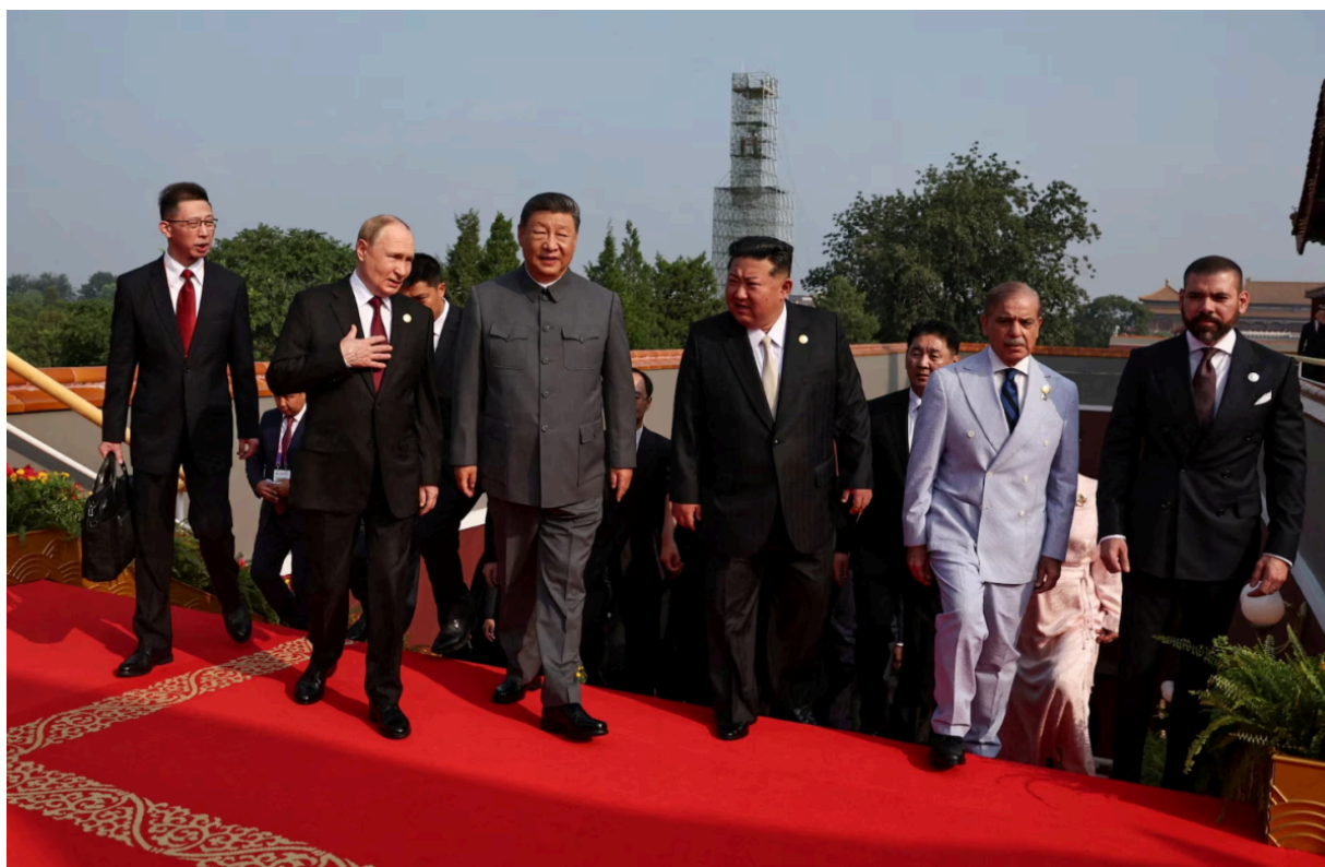
Президент России Владимир Путин, президент Китая Си Цзиньпин, лидер Северной Кореи Ким Чен Ын, премьер-министр Пакистана Шахбаз Шариф и главы иностранных делегаций прибыли на военный парад в честь 80-й годовщины окончания Второй мировой войны, Пекин, Китай, 3 сентября.

Какой бы ни была форма валюты БРИКС, она будет обеспечена золотом, что позволит странам-участницам, имеющим профицит в валюте другого члена, конвертировать его в золото. Такая возможность стала реальной благодаря строительству золотых хранилищ Шанхайской золотой биржей в странах-участницах; одно из них почти готово в Саудовской Аравии.