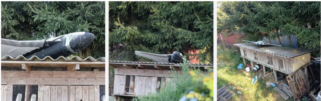
Склеенный из частей «российский» дрон «атакует Польшу»

Нет никаких доказательств того, что Россия или Беларусь запускали дроны, упавшие в Польше. Это была ещё одна попытка обвинить Россию в атаке, которую она не совершала — другими словами, операция под «ложным флагом».