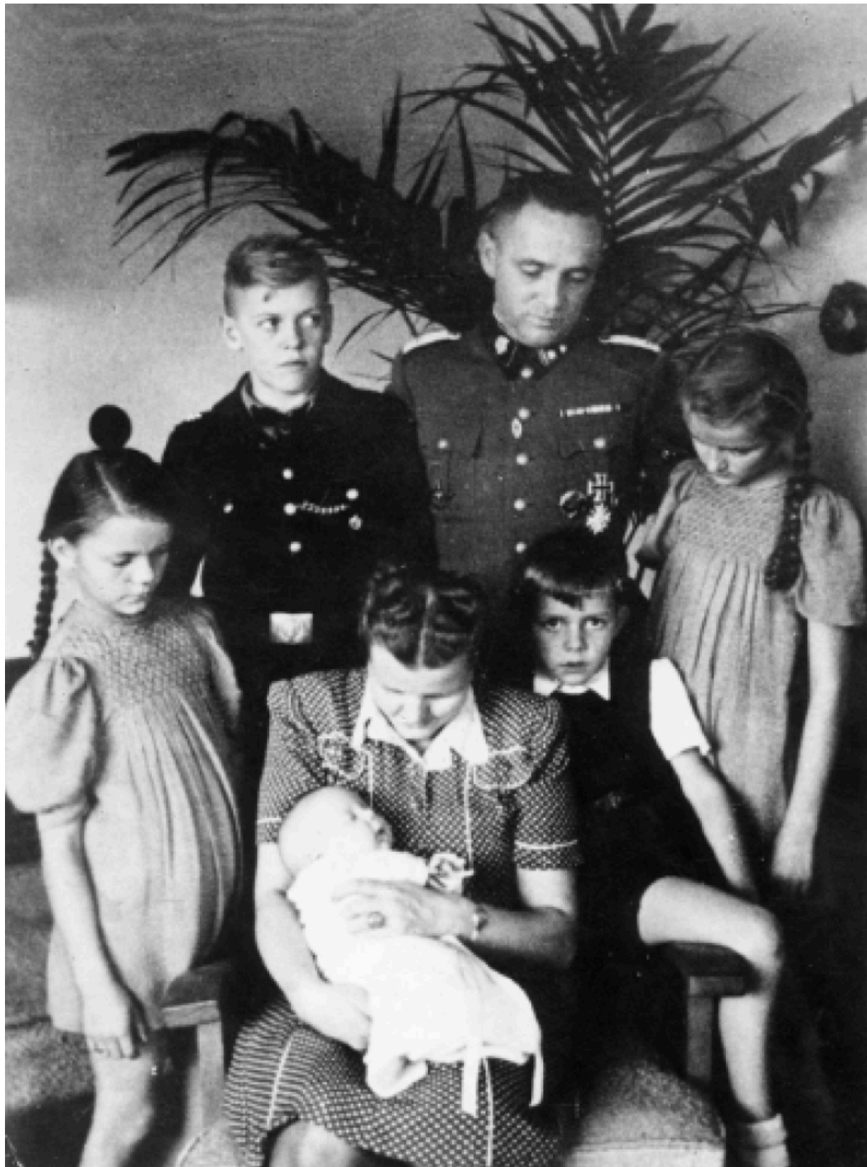
Рудольф Хёсс в своей вилле в Освенциме в роли любящего отца пятерых детей (1943)

Как отец, я не могу понять, как можно одобрять такие действия. Очевидно, что люди, которые поддерживают геноцид – или даже осуществляют его – могут включить в своей совести механизм, позволяющий им различать своих детей и детей «недочеловеков». Исторические примеры тому есть.