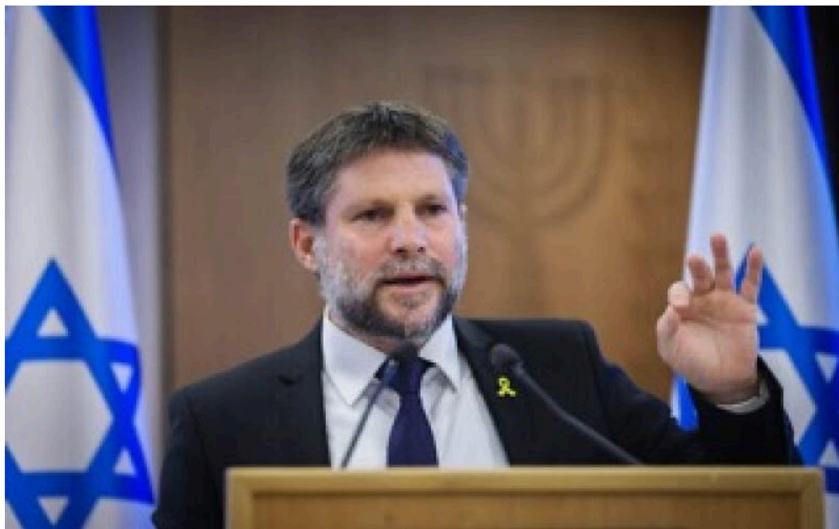
Бецалель Смотрич

Например, Бецалель Смотрич , министр финансов Израиля, в октябре 2024 года: