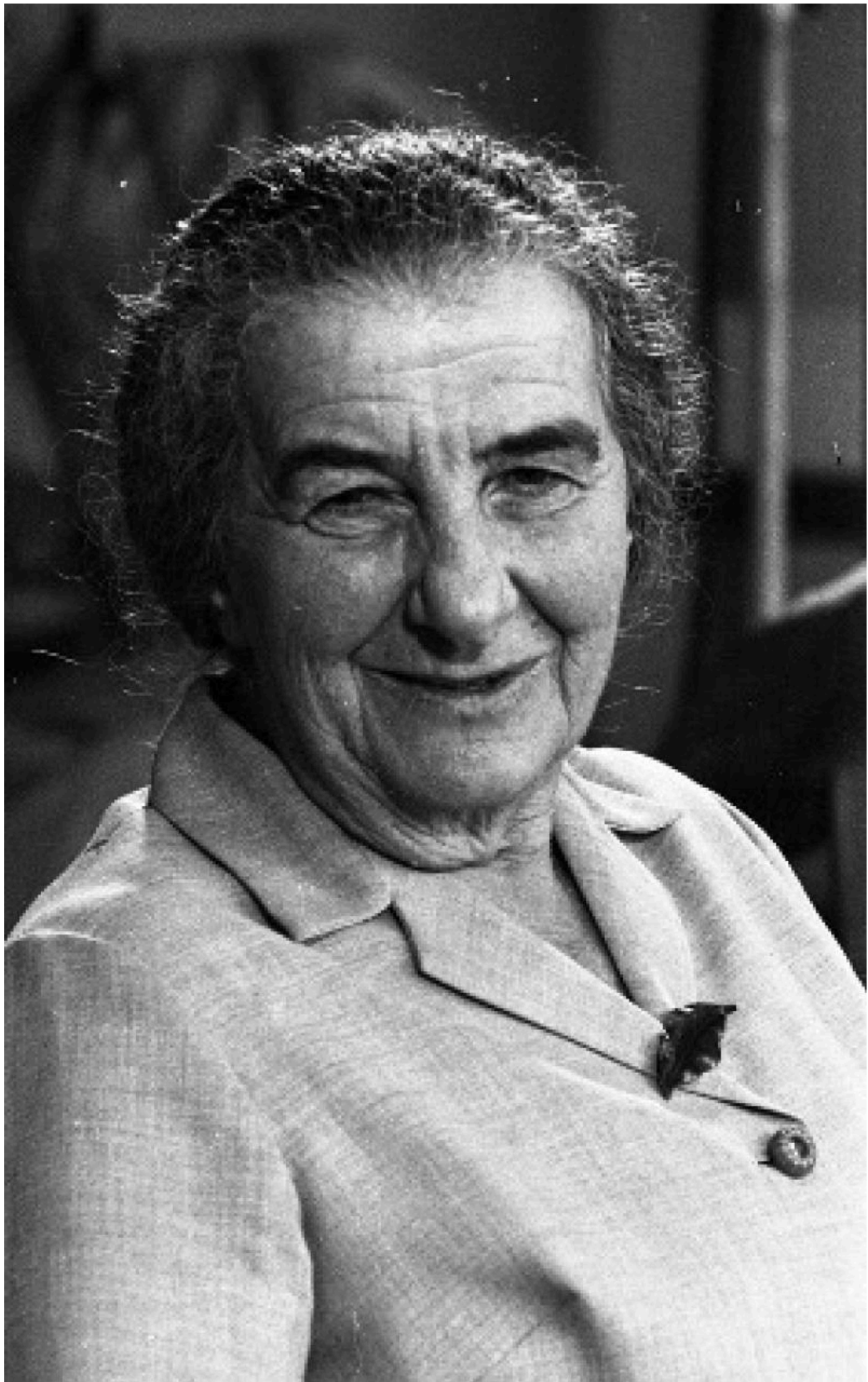
Голда Меир – премьер-министр Израиля в 1969–1974 годах – выглядела старше, чем была на самом деле.