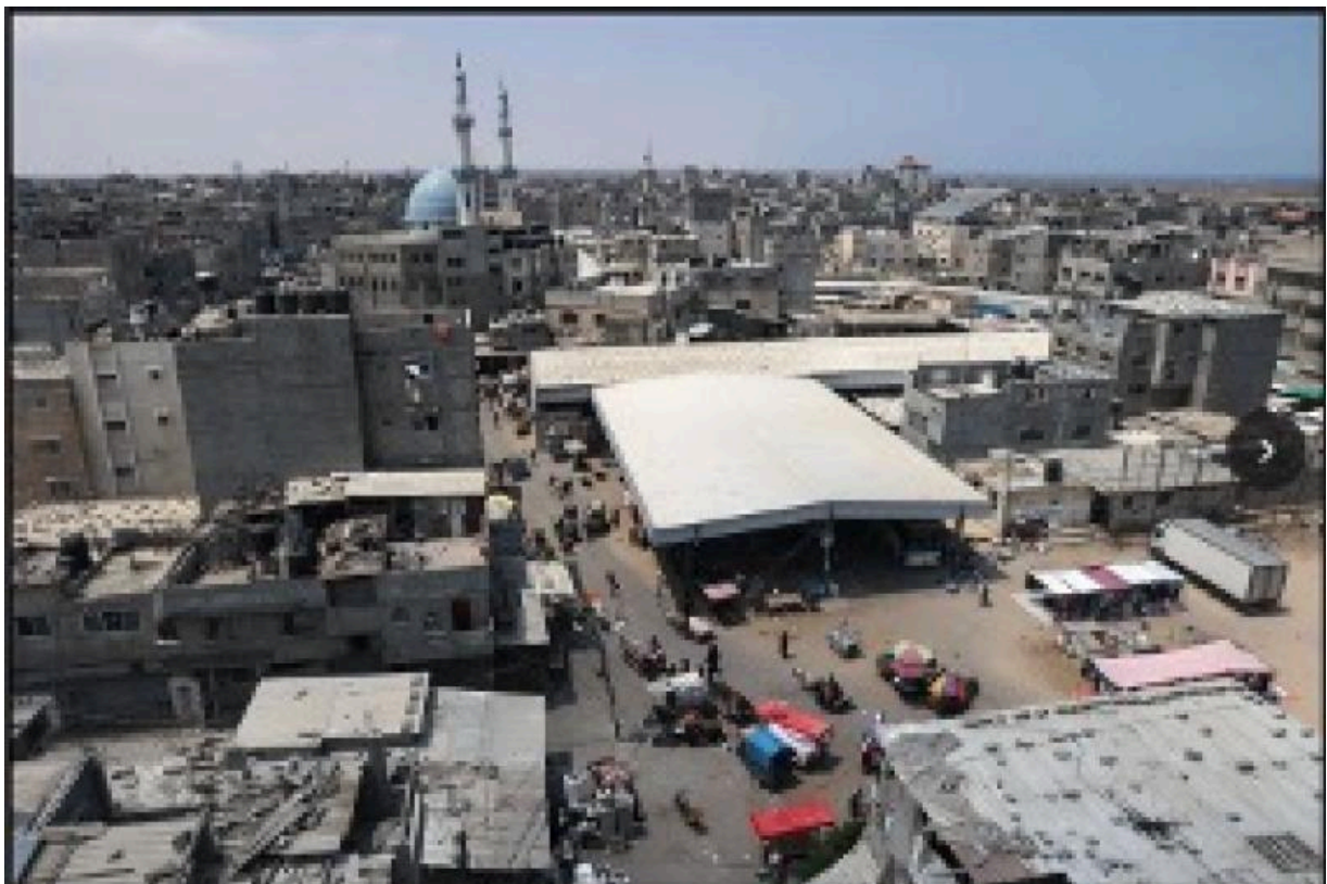
Рафах до разрушения