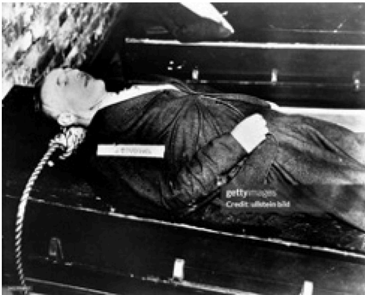
Писать может быть опасно — Юлиус Штрейхер на закате своей карьеры — 16 октября 1946 года

Ниже мы проанализируем действия и высказывания двух медиа-компаний из немецкоязычного пространства, которые представляют почти все медиахолдинги Запада. При этом, в отличие от Европы, в США всё больше звучат критические голоса.