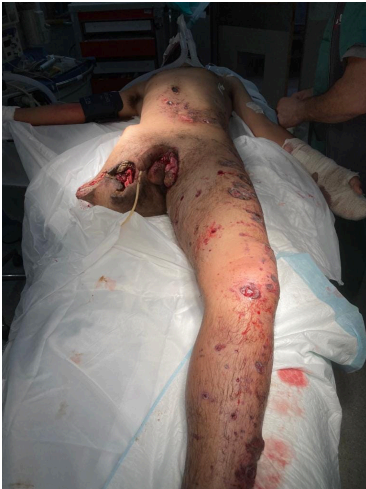
Пациент лишился ноги