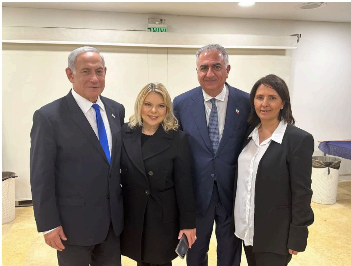
Слева направо: премьер-министр Биньямин Нетаньяху, Реза Пехлеви, министр по делам спецслужб Гила Гамлиэль

Извращенная стратегия Запада в одном кадре: после того как последний демократический президент был свергнут с помощью отца самозванного шаха, клон-сын ввязывается в такую же авантюру - при этом в дружбе с Нетаньяху, который несколько дней назад хотел бомбами проложить путь к смене режима в Тегеране, убив при этом ученых и военных, а также и многих мирных жителей Ирана. Мои источники в Иране только качают головой: никто в Иране, ни молодые, ни старые, даже те, кто уважал старого шаха, не хочет видеть этого мальчишку у власти.