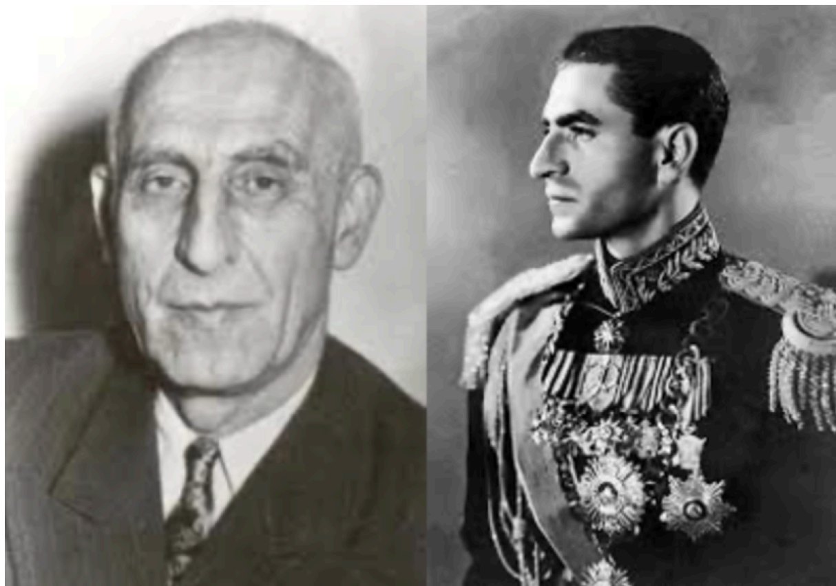
Премьер-министр Мохаммад Моссадык - Шах Мохаммад Реза Пахлави

«Аякс» МИ-6 (секретная разведывательная служба Великобритании) и ЦРУ устроили переворот против Моссадыка и установили марионеточного правителя — шаха. Тот отменил демократические достижения и вновь передал все богатства США и Великобритании. Американцы, в свою очередь, вытеснили британцев из этого бизнеса - бизнес есть бизнес. За эту услугу шаху заплатили по-королевски.