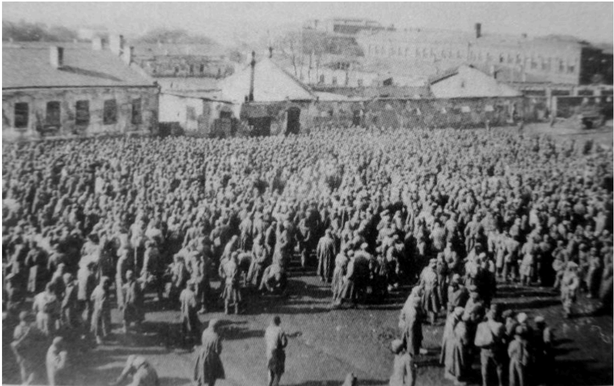
Лагерь для советских военнопленных в Кировограде, осень 1941 года – Сталаг 305

В один из дней из домика охраны вынесли стол и табурет. Один из немецких офицеров взобрался на стол, его окружила охрана. Мы поняли, что нам что-то хотят сообщить, и придвинулись вплотную, чтобы лучше слышать. Когда народ успокоился, офицер стал говорить по-русски, плохо выговаривая слова. Он сообщил, что "большевистские" силы разбиты, что немецкая доблестная армия находится у стен Москвы и Ленинграда и что эти города скоро капитулируют. Но большевики собирают последние силы и оказывают отчаянное сопротивление. Немцы не пожалеют жизни своих солдат, чтобы окончательно освободить русский народ от большевиков. Но необходимо, чтобы русские сами помогли немцам в этом. Здесь на Украине создается добровольческая освободительная армия из русских и других народов Союза под командованием русских офицеров. Вступившим в эту армию будет выдано немецкое обмундирование, оружие и продовольственный паек, как и всем немецким солдатам. Мы призываем вас записываться в эту армию. Кто готов - шаг вперед. С разных концов лагеря по одному стали выходить. Я насчитал 17 человек. Остальные стали пятиться назад, напирая спинами на тех, кто стоял сзади. Немец, видя, что больше желающих нет, истерическим голосом закричал: