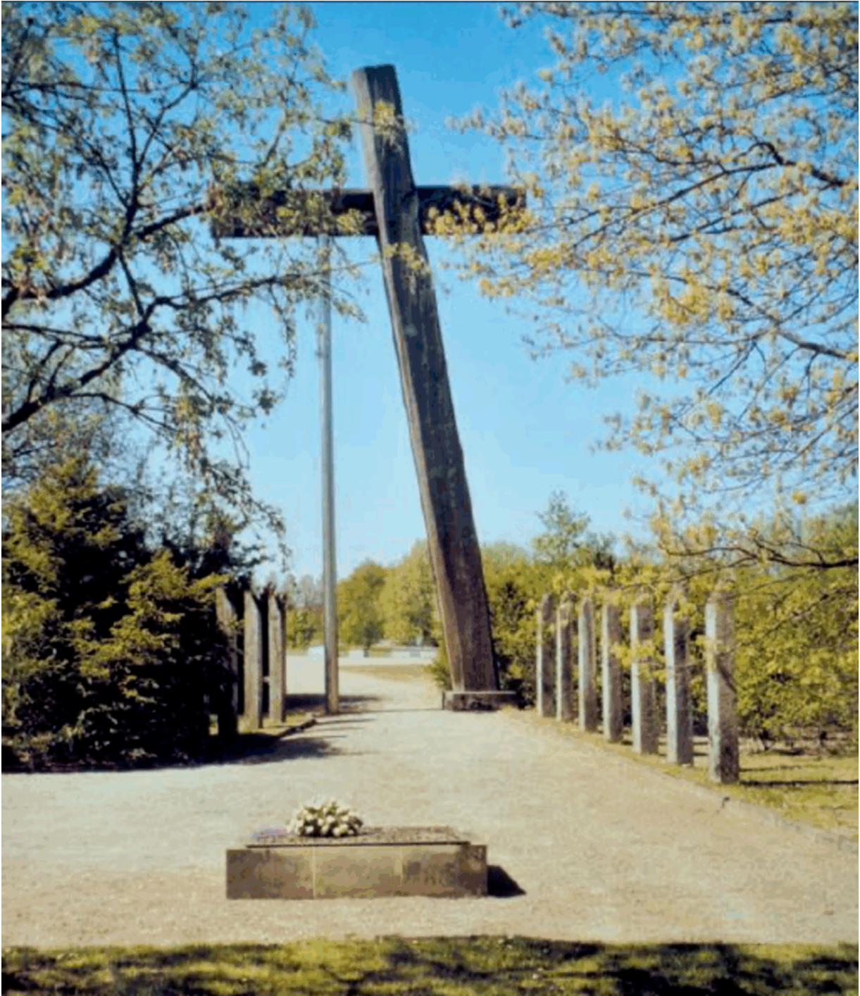
Мемориальный комплекс Нойбранденбург-Фюнфайхен

Эшелон прибыл в немецкий город Нойбранденбург на севере Германии. Отцепив четыре вагона, эшелон ушел дальше. Я остался в Нойбранденбурге. На окраине города для нас был подготовлен лагерь, который был уже в значительной степени заселен. И мы, как оказалось, были его последним пополнением. Все мы предварительно прошли санобработку, некоторым даже сменили одежду. Мне, к примеру, достался поношенный костюм. Я заметил, что кладовая была забита подобными вещами. Вероятнее всего, это была одежда уничтоженных в фашистских концлагерях пленных.