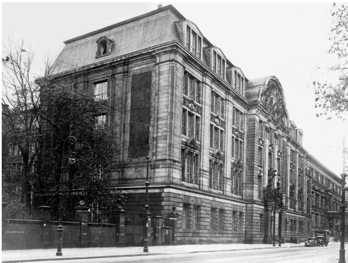
Штаб-квартира гестапо в Берлине