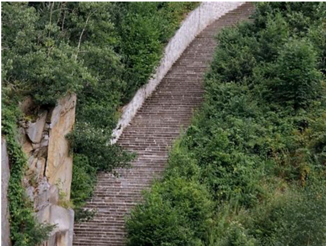
Лестница смерти концлагеря Маутхаузен сегодня

С религиозной точки зрения бестелесный дух человека после смерти возносится на небеса или, на худой конец, погружается в преисподнюю, оставив здесь на земле свою брэнную оболочку. В преисподней этот бестелесный дух поджаривается на сковороде, варится в котле или вообще нечистые экспериментируют с ним и делают, все, что вздумают. А грешникам от этого больно или нет? Они же бестелесные? И кто, собственно, распределяет души умерших, кого в рай, кого в ад? Господь Бог? Но ведь из Писания известно, что Сатана не боится Бога, не подвластен ему.