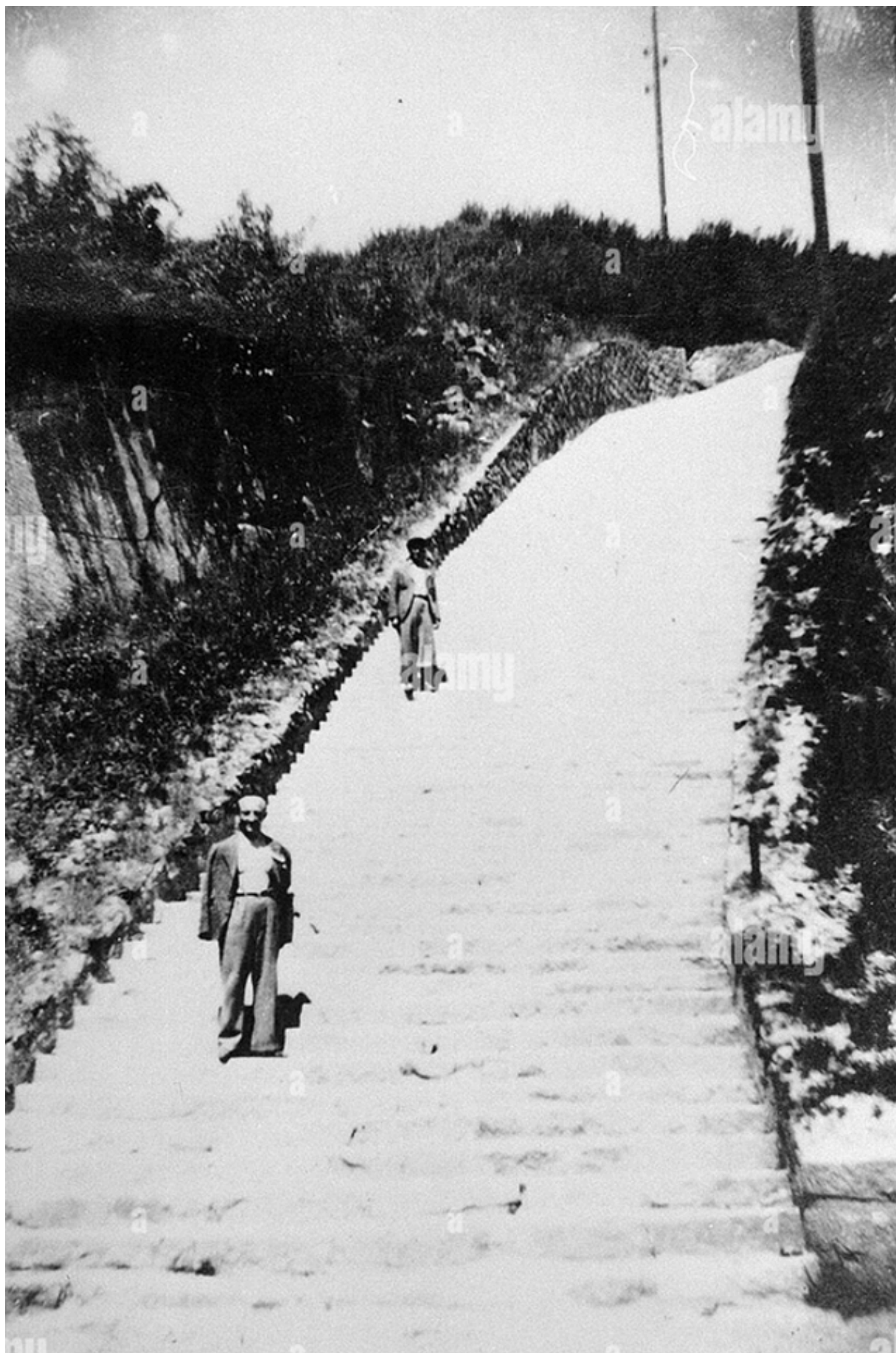
Два выживших на лестнице смерти концлагеря Маутхаузен