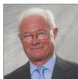
Саймон Хант Автор