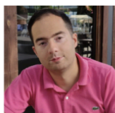
Денис Добрин Управление, автор