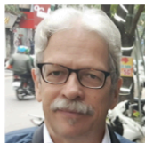
Феликс Абт Автор