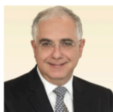
Энтони Деден Автор