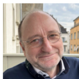
Рене Циттлау Автор