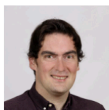
Рафаэль Лутц Автор