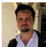
Стефано ди Лоренцо Автор