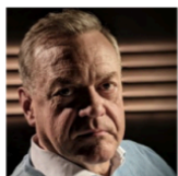
Дирк Польманн Автор