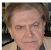
Вольфганг Биттнер Автор