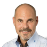
Клаудио Грасс Автор