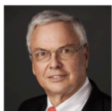
Карл Экштайн Автор