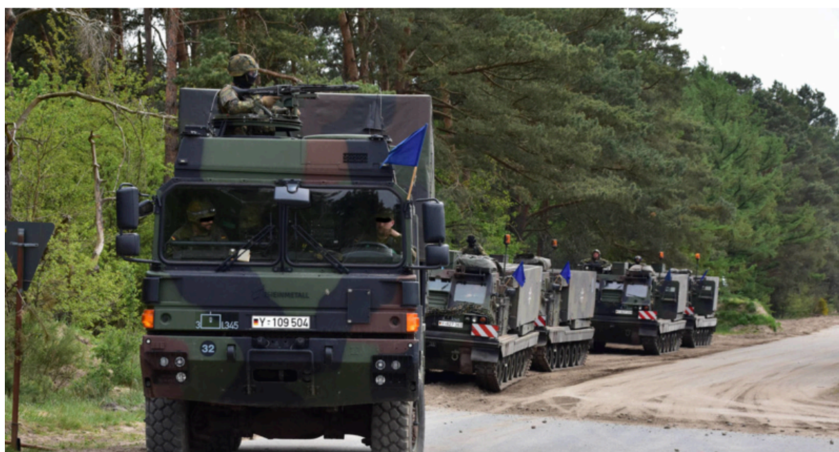
Грузовик UFG Бундесвера фирмы Rheinmetall на учебном полигоне Веттинер-Хайде, 11 мая 2022 года.

Поскольку федеральное правительство намерено создать самую сильную обычную армию Европы и сократить военную зависимость от США, израильско-венгерский эксперт по безопасности Роберт К. Кастель высказывает обоснованные сомнения, действительно ли эта программа вооружений направлена на предотвращение российского нападения. В то время как Польша закупает танки, артиллерию, противотанковые ракеты HIMARS и вертолёты, Германия приобретает лишь 20 истребителей Eurofighter и 1400 транспортных машин для войск.[88] Однако основу современной войны составляют дроны, баллистические ракеты, артиллерия. Таким образом, немецкая политика закупок вообще не ориентируется на уроки российско-украинской войны. Эти машины больше подходят для милитаризованных полицейских задач.[89]