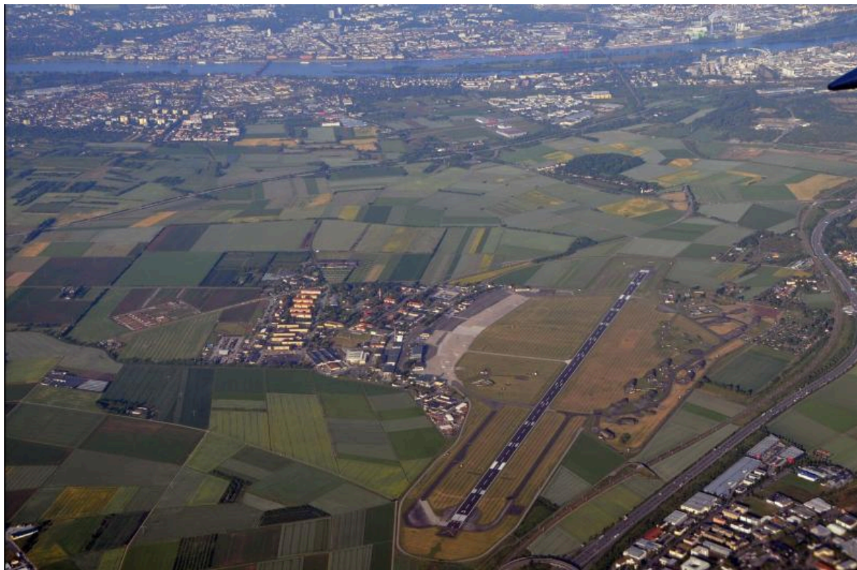
Визбаденский военный аэродром с казармами Люциуса Д. Клея, 2009 год

Нарушающую международное право агрессивную войну Израиля и США против Ирана федеральный канцлер Германии комментирует словами: «Это грязная работа, которую Израиль делает за всех нас»[14]. О геноциде палестинцев правительства ЕС не говорят ни слова. Изодрённый садизм власти сбрасывает свои покровы и публично предстает в непристойной форме — регресс в подростковую разновидность политической некрофилии.[15]