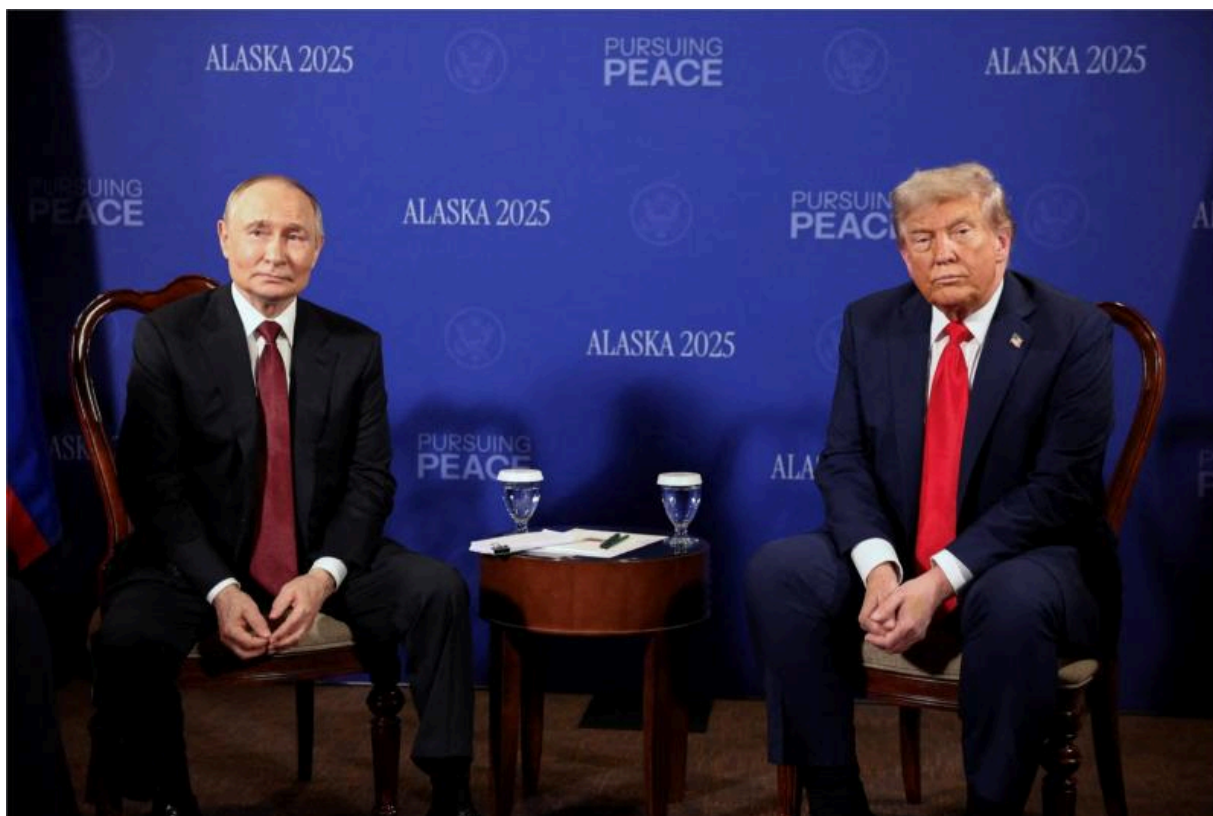
Путин и Трамп в Анкоридже

Германия находится в затруднительном положении. Она была вытеснена из игры собственными дегенеративными элитами. Федеративная Республика Германия до сих пор играет ключевую роль в войне на Украине. Речь идет о войне Соединенных Штатов и их вассалов из НАТО против Российской Федерации на украинской территории. Украина в этом случае является жертвенным ягненком, которого ведут на заклание. Германия является инструментом в руках Вашингтона. [23] Федеративная Республика Германия перестраивается под патронажем Соединенных Штатов. Германия ведет себя как образцовый ученик-милитарист и служит Вашингтону в европеизации войны, ведомая исполнителями, компрадорским режимом, который выступает как оккупационная сила в собственной стране. Канцлер при этом выглядит как представитель финансовой индустрии США, который не упускает из виду прибыльные интересы своего бывшего работодателя Blackrock.[24] Ларс Клингбайль также полностью следует традиции трансатлантического подчинения.[