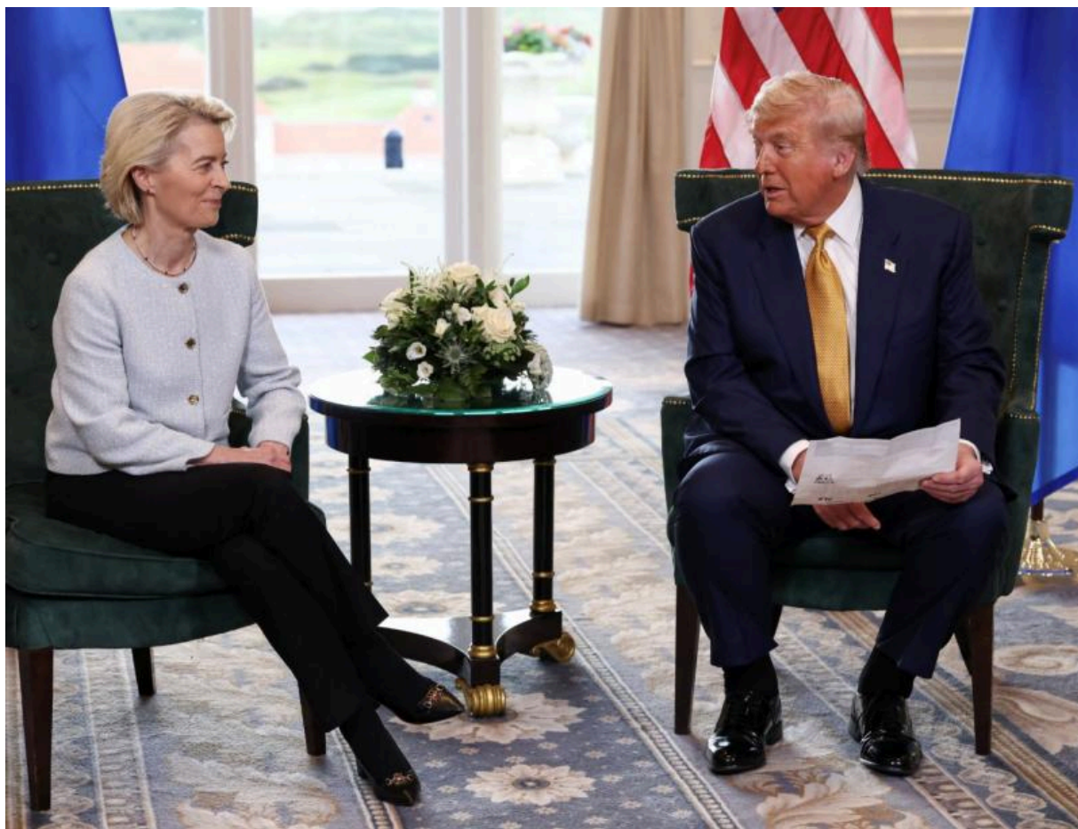
фон дер Ляйен и Трамп в Белом доме

Теперь можно задаться вопросом: в чем заключается эта краткосрочная выгода для Еврокомиссии? В Брюсселе работает около 32 000 бюрократов, которые не подлежат демократическому контролю, а если добавить к ним ЕЦБ, то их число достигает максимум 60 000. Эта бюрократия ЕС движима собственным интересом в приобретении как можно большей власти. Речь идет о власти над государствами-членами, которая проявляется в праве принимать собственные решения в области таможенных пошлин, налогов и бюджета, минуя национальные правительства. С точки зрения этой бюрократии ЕС, подчинение НАТО и США является возможностью получить финансовую независимость и вооруженную силу.