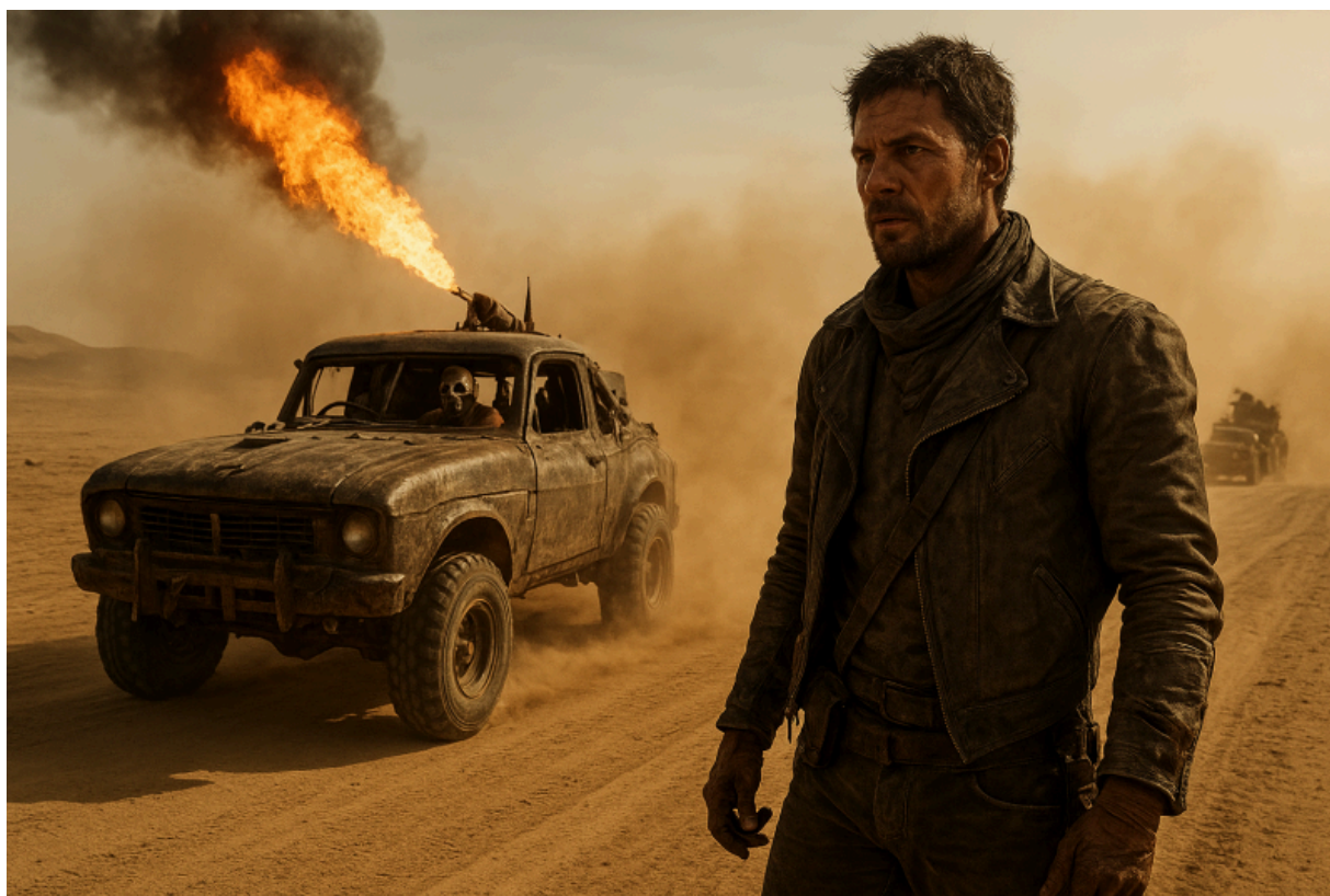
Безумный Макс, Будущее

В целом мы наблюдаем здесь истощение немецкой демократии. После инсценировки с коронавирусом большинство населения оказалось в состоянии покорного выгорания, усыпленное пропагандой и лишенное ориентиров под агрессивными наставлениями о разнообразии. Массовый гнев, вызванный неолиберальным наступлением на социальное государство и относительно безопасные рабочие места, используется политико-медийным комплексом в качестве топлива для новой экономики эмоций.[40] Параллельно с этим мы отворачиваемся от международного права в международном контексте и обращаемся к праву сильнейшего — процессу целенаправленной децивилизации, который готовит почву для новых войн. [41] Спусковой механизм, к которому привели нас имперские фантазии трансатлантической элиты о великой державе, капитализм, движимый финансовыми рынками, а также «ядовитый коктейль из политики жесткой экономии, свободной торговли, долгового рабства и низкооплачиваемых precarious рабочих мест»[42], заканчивается новым варварством.