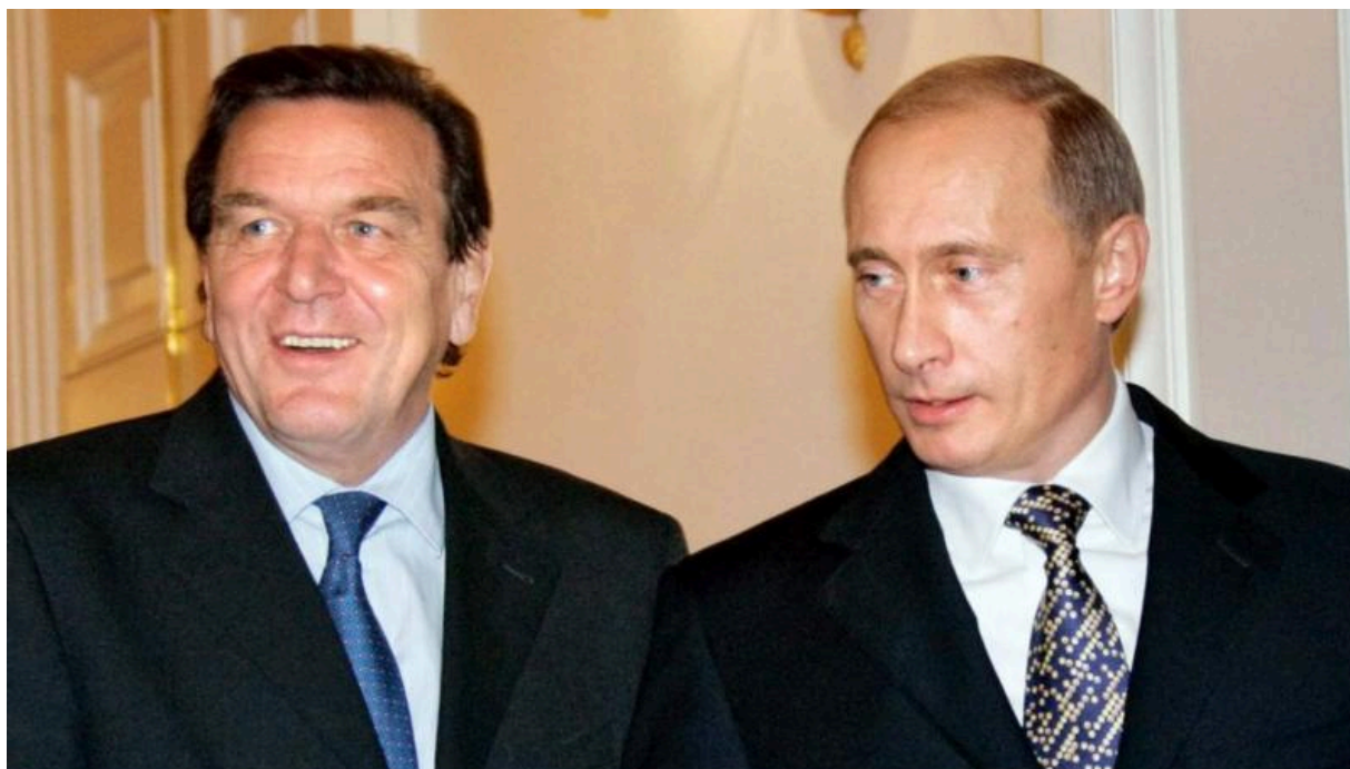
Канцлер Шредер и президент Путин в 2005 году

С окончанием эры Шредера в 2005 году Германия перешла на тактику Вашингтона, предлагая кажущиеся уступки за столом переговоров, но при этом придерживаясь стратегии ослабления и экономического подчинения Восточной Европы и России. Это показывает провал Минского процесса II, целью которого, по заявлениям, было обмануть русских и дать Украине время для вооружения. [63] Этот подход сохранялся вплоть до провала мирных переговоров в Стамбуле весной 2002 года, которые, по-видимому, были использованы для того, чтобы побудить русских вывести свои войска из-под Киева. Это, как и нападение на газопровод «Северный поток», показывает, что Германия сегодня, как выразился Эммануэль Тодд, «снова является оккупированной страной». [64]