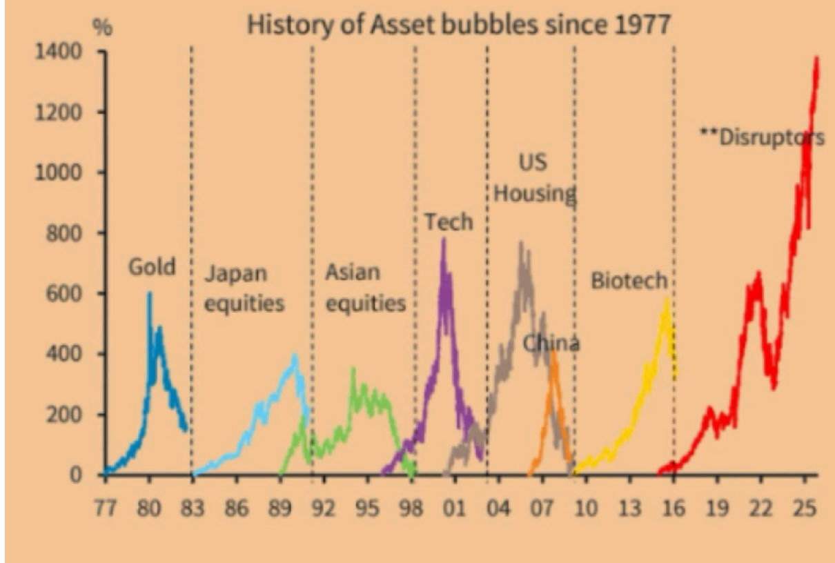
FIGURE 52. AI trade is looking stretched now compared to past bubbles