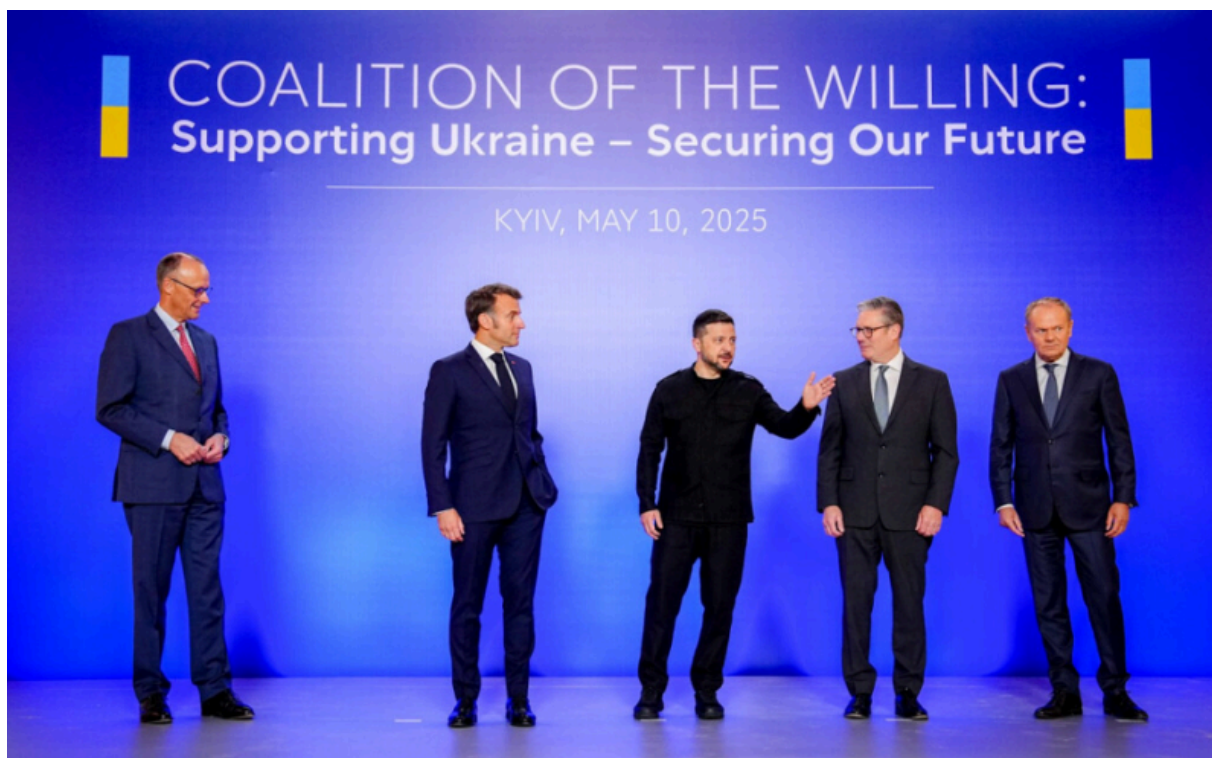
Маппет-шоу для западной прессы – Коалиция желающих, 10 мая 2025 года

В тот момент, когда наступит мир, эти люди утратят право на существование, поскольку в кратчайшие сроки станет ясно, что воинственные призывы были направлены не на защиту соответствующих стран или ЕС, а на сохранение рабочих мест этой касты.