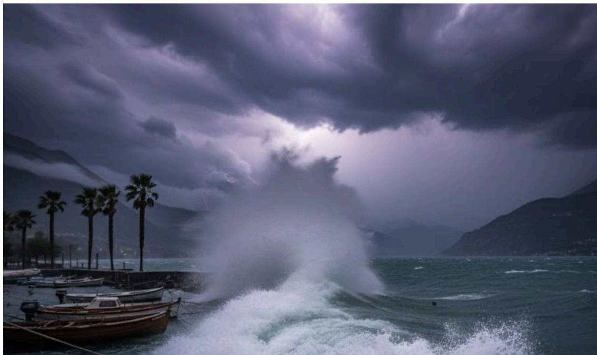
Шторм на озере Маджоре

Я осознанно использую термин «шторм». Когда я говорю это слово, я имею ввиду не только шквальный ветер, но и ветровые системы, которые могут привести изменению направления ветра на 360 градусов всего за несколько секунд — да, на этот раз речь именно о полных 360 градусах. Это видение основано на воспоминаниях из моего детства о Лаго-Маджоре — озера, окружённого горами, частично находящегося в итальянской части Швейцарии, и большей частью в Италии, где штормы отличаются тем, что благодаря нисходящим потокам возникает именно это явление - внезапное и резкое изменение направления ветра.