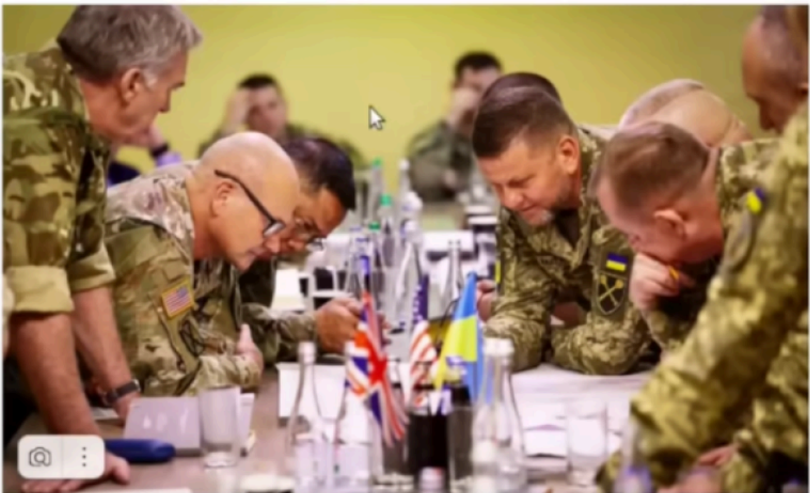
Ukrainian, American and British military leaders during a meeting in Ukraine in August 2023. Valerii Zaluzhnyi

En 2014, les États-Unis ont renversé le gouvernement élu de l'Ukraine. Ils ont mis en place un régime qui leur était fidèle. Selon le New York Times , la CIA a pris le contrôle de tous les services de renseignement ukrainiens. Nous rappelons que les États-Unis, en collaboration avec l'OTAN, ont restructuré et formé l'armée ukrainienne de 2014 à 2022. Nous avons notamment cet article du New York Times, The Secret History of the War in Ukraine (L'histoire secrète de la guerre en Ukraine), qui explique comment les États-Unis mènent toute la guerre contre la Russie depuis Wiesbaden, en Allemagne.