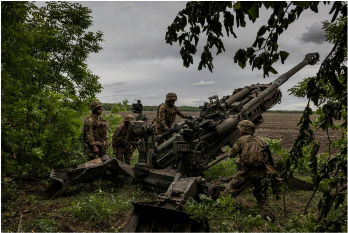
▲ Ukrainian soldiers prepare to fire an M777 howitzer at Russian forces in the Donetsk region.

Agence de presse de la République islamique, 12 décembre 2025