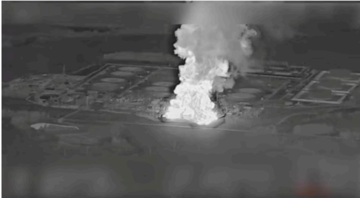
Smoke rises from the Unecha oil pumping station during a fire, in Unechsky district, Bryansk region, Russia, August 21, 2025 in this night vision still image obtained from social media video. YouTube @MACYARBIRDS via REUTERS/File Photo Purchase Licensing Rights

Les États-Unis mènent cette guerre contre la Russie. Pour ce faire, ils utilisent l'Ukraine et l'Europe. C'est la guerre de l'Amérique. Ce sont eux qui ont déclenché la guerre. Ce sont eux qui la mènent. Sans les États-Unis, la guerre ne pourrait pas continuer.