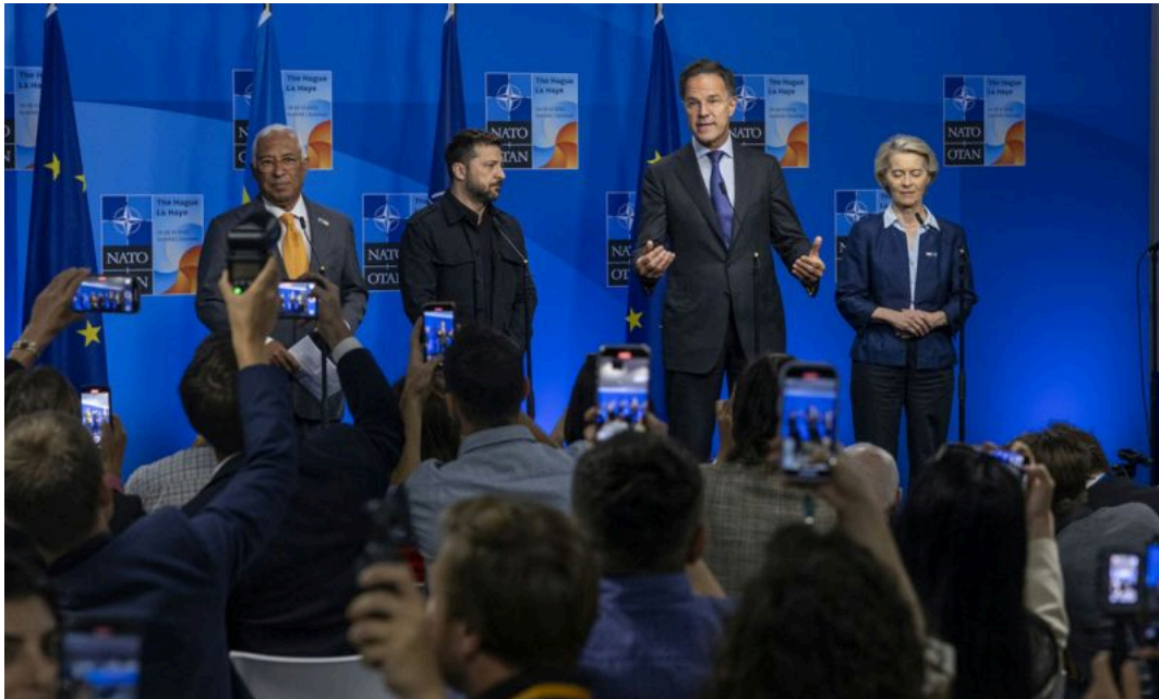
Juin 2025 : (de gauche à droite) António Costa (président du Conseil européen), Volodymyr Zelenskyy (président de l'Ukraine), Mark Rutte, secrétaire général de l'OTAN, et Ursula Von Der Leyen (présidente de la Commission européenne)