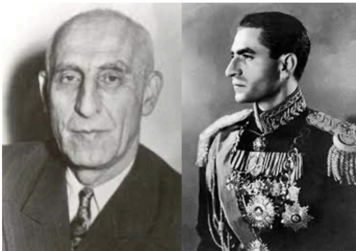
Premier ministre Mohammad Mossadegh — Shah Mohammad Reza Pahlavi

transférer l'immense richesse pétrolière à son peuple, les Britanniques et les Américains ont réagi immédiatement. Avec l'opération secrète Ajax, le MI-6 et la CIA ont orchestré un coup d'État contre Mossadegh et installé le Shah comme pantin docile. Celui-ci a balayé les acquis démocratiques et restitué les richesses aux États-Unis et au Royaume-Uni. Les Américains, pour leur part, ont ensuite évincé les Britanniques du marché. Business is business. Le Shah a été grassement payé pour ce service de soumission.