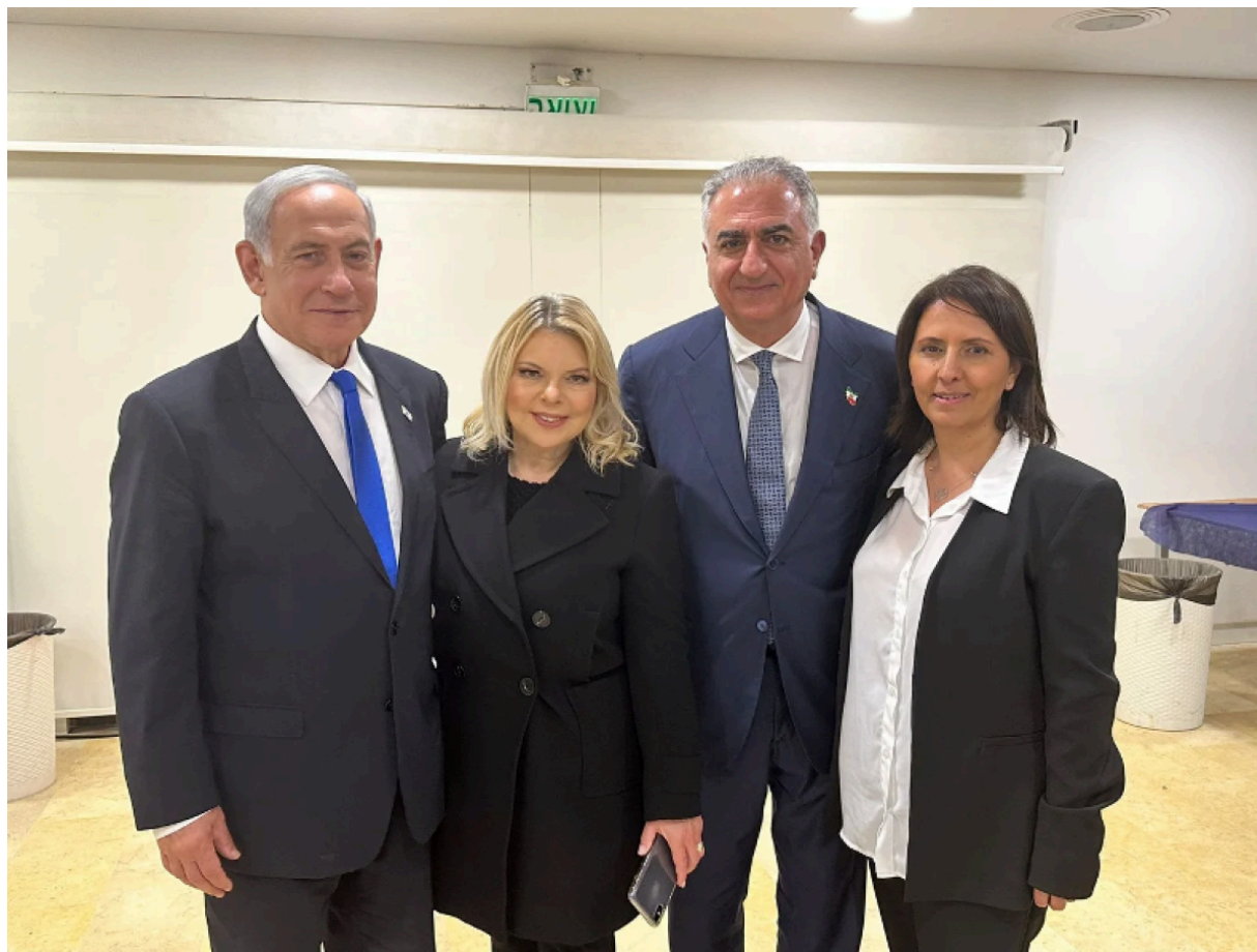
De gauche à droite : le Premier ministre Benjamin Netanyahu, Reza Pahlavi, la ministre du Renseignement Gila Gamliel

La photo ci-dessous montre le jeune Shah lors d'une visite en Israël le 17 avril 2023, aux côtés de Benjamin Netanyahu et de la ministre israélienne du Renseignement, Gila Gamliel.