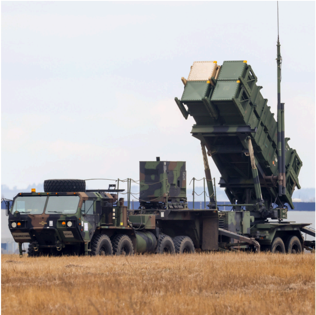
Système Patriot