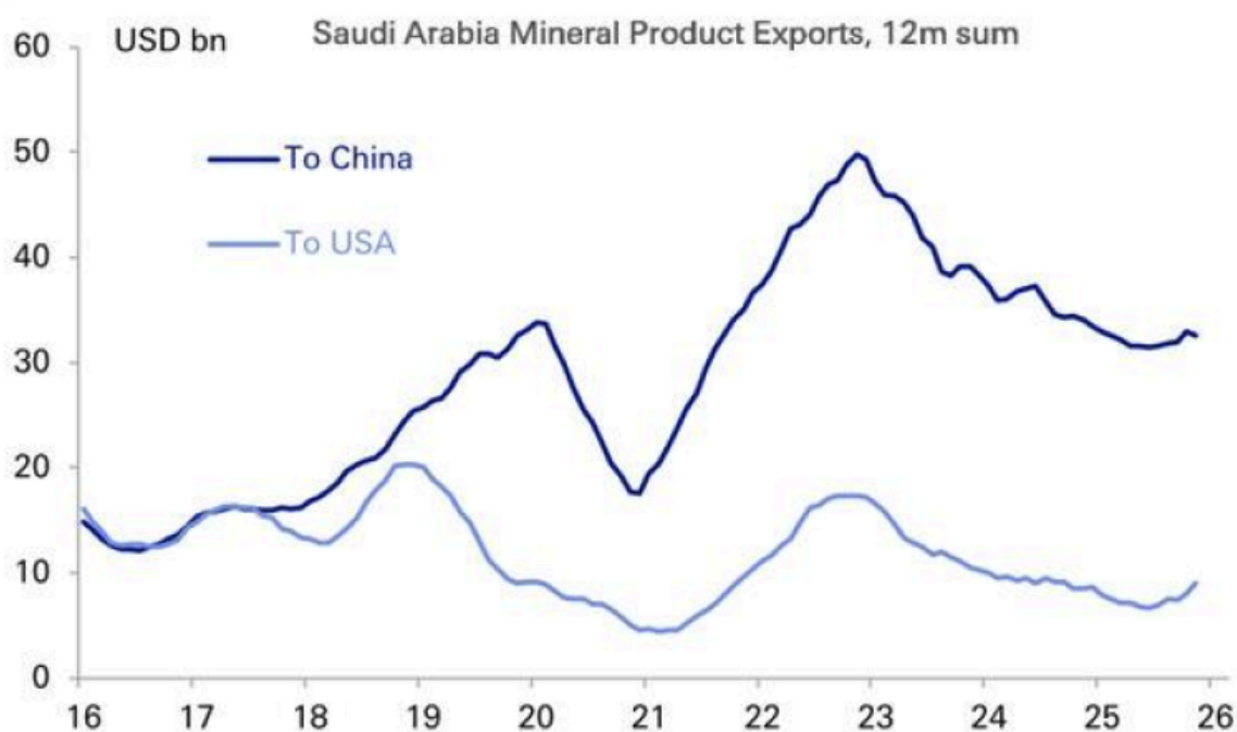
Figure 2: There were already signs of instability to petrodollar foundations: Saudi Arabia sells four times as much oil to China now as to the US

Cet ordre perdure encore aujourd'hui, malgré le fait que la structure des exportations saoudiennes se soit profondément recomposée. Selon la Deutsche Bank , pour chaque baril exporté vers les États-Unis, environ quatre sont désormais destinés à la Chine. Washington étant devenu, entre-temps, le premier producteur mondial grâce au pétrole de schiste.