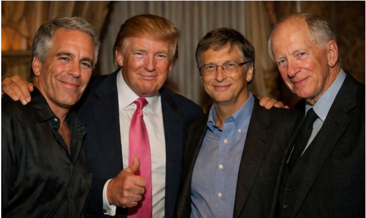
Friends? - Epstein, Trump, Gates, Rothschild