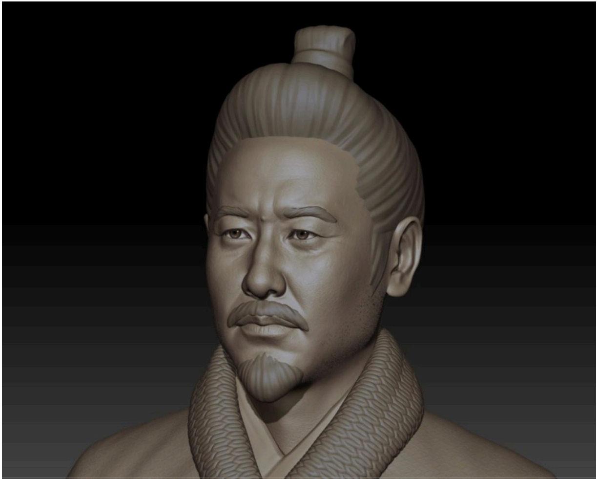
General Sima Yi, der Vordenker des Dritten Königreichs, unbekannt für den Ignoranten Zelensky

Zelensky wollte auch den populäreren General Zaluzhny, den Oberbefehlshaber der Armee, zum Schweigen bringen, den er als möglichen Herausforderer für die Präsidentschaft fürchtete. Die Handgranate, die in den Händen von Zaluzhnys engstem Vertrauten detonierte und als " Geschenk " zu seinem Geburtstag verschickt wurde und ihn tötete und seinen Sohn schwer verletzte, war eine klare Warnung an den General.