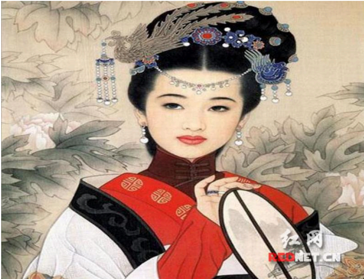
Gemälde der Prinzessin Wencheng

Als Adlige, die in der konfuzianischen Tradition erzogen worden war, wuchs Wencheng in dem Glauben auf, dass die Fürsorge für das Volk die vorrangige Pflicht eines Herrschers sei. Dies spiegelt sich in den Gaben wider, die sie nach Tibet mitbrachte: landwirtschaftliche Techniken, Webkunst, medizinisches Wissen, buddhistische Sutren, Statuen und Mönche. Sie verband praktische konfuzianische Methoden mit buddhistischem Mitgefühl, um sowohl für materiellen Wohlstand als auch für spirituelle Belange zu sorgen. Prinzessin Wencheng lebte fast 40 Jahre lang in Tubo, überlebte ihren Ehemann und blieb aus Solidarität mit dem Volk in Tibet, wo sie einen bleibenden kulturellen Einfluss ausübte.