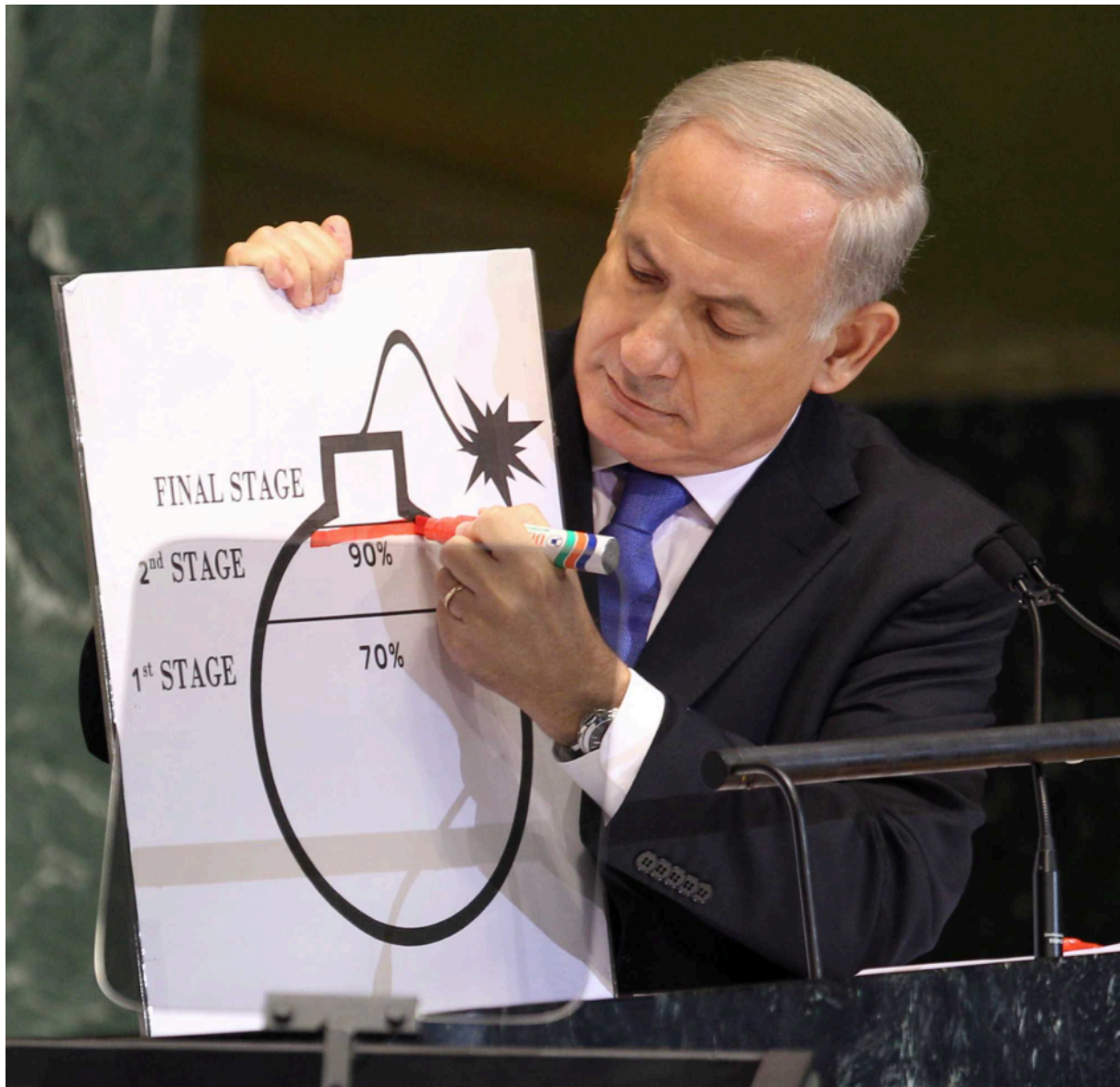
Natanyahu vor der UNO

Dieses Propagandatrommelfeuer ist ein uralter Hut. Seit Jahrzehnten steht dieses Domsday-Szenario "unmittelbar bevor".