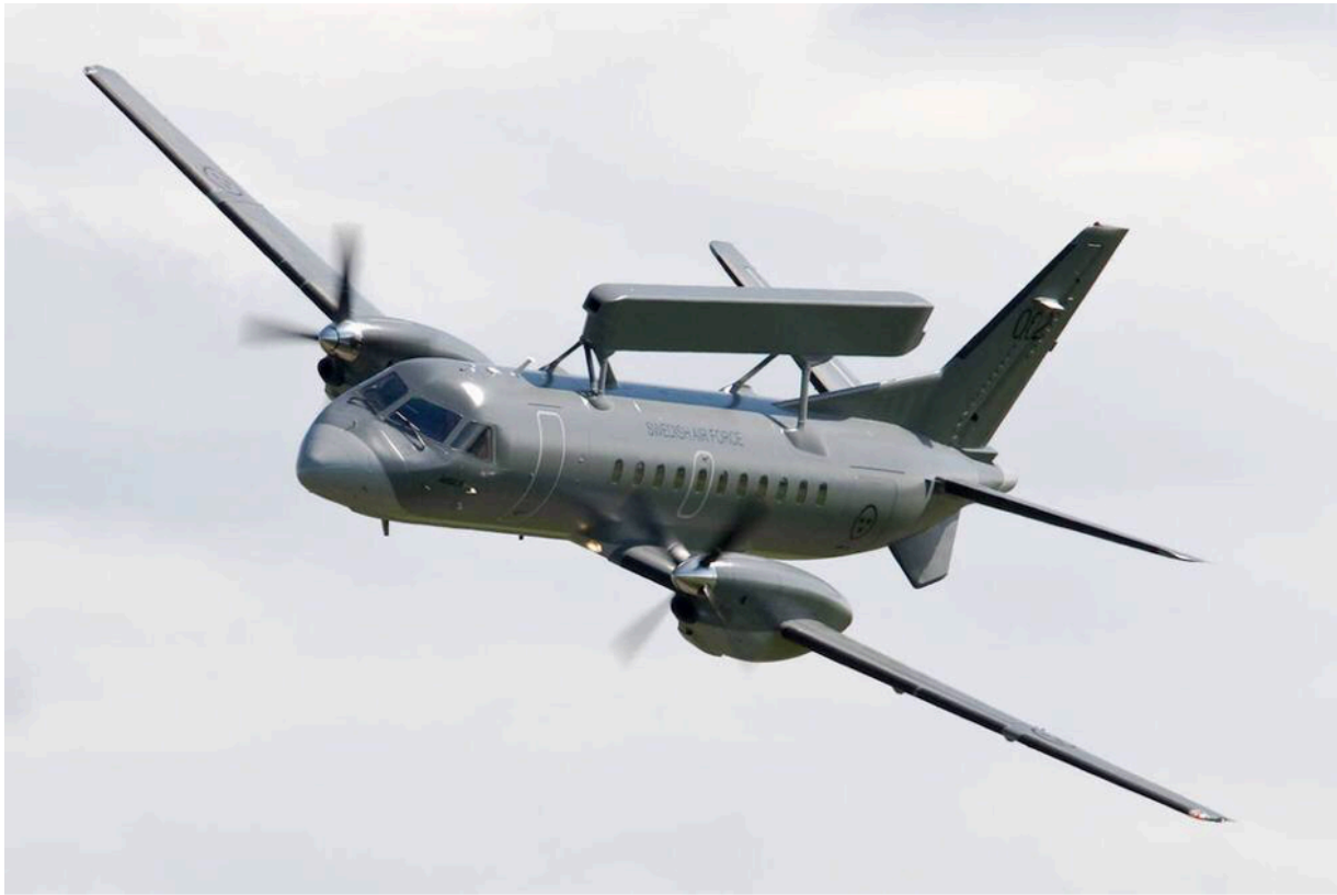
SAAB 340 AEW Erieye

In Poltawa wurde in grossem Stil Personal für die Bedienung von Drohnen sowie für die elektronische Aufklärung ausgebildet. Schweden beabsichtigte den Verkauf von zwei Flugzeugen des Typs SAAB 340 AEW Erieye, einer kleineren Ausführung der amerikanischen AWACS-Flugzeuge.