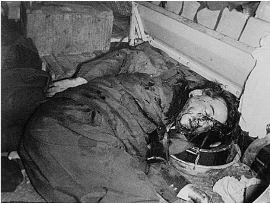
Das typische Ende einer amerikanischen Marionette: Ngo Dinh Diem

Europa, besonders Deutschland, wird ausser sich sein. Deutschland hat sich als treuer Vasall für die Interessen der USA in der Ukraine ruiniert, wirtschaftlich und gesellschaftlich und mit seiner militärischen und finanziellen Unterstützung zur Zerstörung der Ukraine beigetragen. Falls Trump Präsident wird, lässt dieser Deutschland fallen und die Rechnung für den Wiederaufbau auf dem Tisch in Berlin liegen.