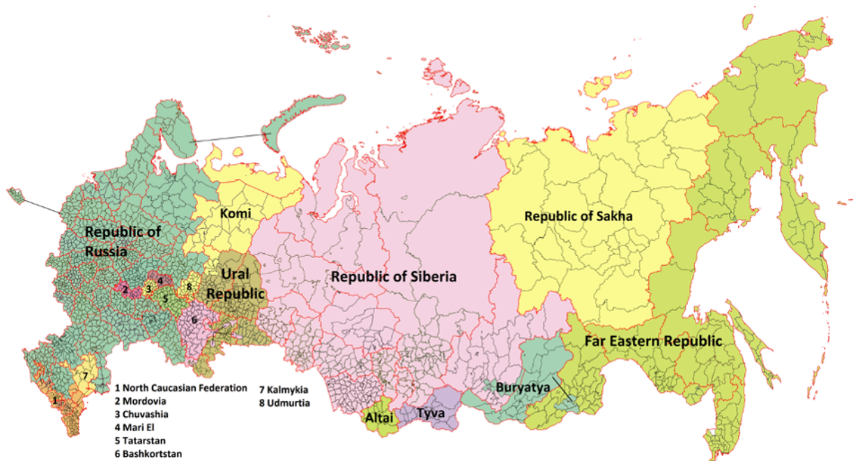
Russland nach der geplanten Zerstückelung

Ganz anders wurde mit Russland verfahren. Russland sollte nie zum Partner des Westens werden und Professor Sachs zeigt auf, wie er als Berater von Gorbatschow und dann von Jelzin scheitern musste, Unterstützung vom Westen zu organisieren. Denn das Ziel der USA war nicht dessen Gesundung, sondern der Zerfall Russlands in kleine verdaubare Portionen, welche dann von den USA durch Marionetten übernommen worden wären. Dieser Plan wird bis heute mit enormem Aufwand verfolgt und findet im Ukraine-Krieg seinen aktuellen Höhepunkt. Wir haben darüber bereits im letzten Sommer in einem Artikel berichtet: « Die geplante Zerstückelung Russlands ».