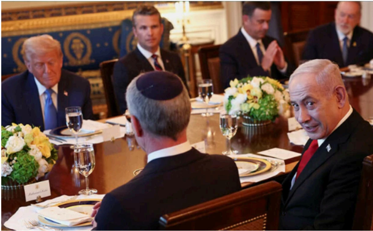
Der israelische Ministerpräsident Benjamin Netanjahu während eines bilateralen Abendessens mit US-Präsident Donald Trump im Weißen Haus in Washington, DC, USA, am 7. Juli.

Nun übertreffen USrael auch noch die oxymoronische „Humanitäre GHF-Stiftung“ und präsentieren einen neuen Orwellschen Plan: eine „ humanitäre Stadt “, in der 600.000 Palästinenser aus dem Norden Gazas in einem ummauerten Gelände im Süden untergebracht werden sollen – wo man einchecken, aber nicht auschecken kann. Das neue israelische Konzentrationslager, in dem mehr als ein Viertel der Bevölkerung Gazas interniert werden soll, stellt viele der Nazi-Lager des Zweiten Weltkriegs in den Schatten.