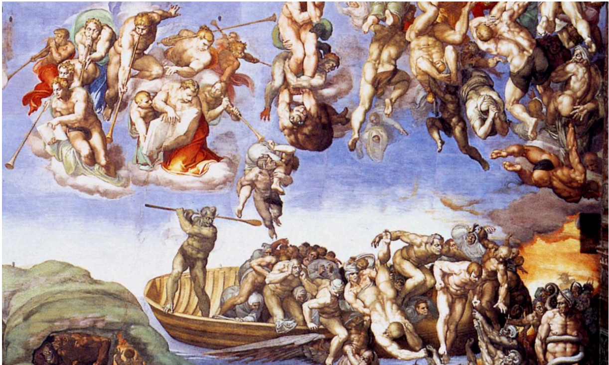
Michelangelo Buonarroti: Das Jüngste Gericht – Fresko der Sixtinischen Kapelle im Vatikan, 1536-1541