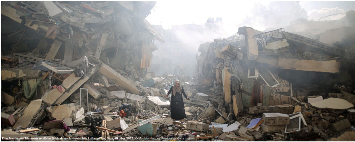
Eine Frau in den Trümmern zerstörter Gebäude nach israelischen Luftangriffen, Gaza, Oktober 2023.

Das erinnert an das Schreiben des Chefs des SS-Sicherheitsdienstes Reinhard Heydrich vom 20. Oktober 1941 an Heinrich Himmler, in dem er sich über die mangelnde Effizienz des deutschen Beschusses auf die Städte Warschau und Leningrad beschwerte und den Reichsführer SS an eine Weisung Adolf Hitlers zur „Auslöschung“ der Städte erinnerte: