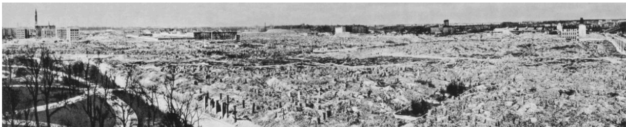
Das Warschauer Ghetto nach seiner Zerstörung: