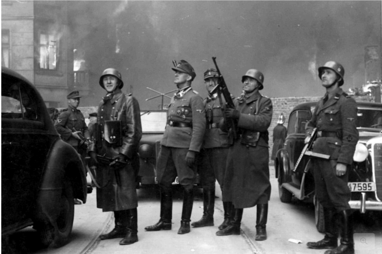
SS-Brigadeführer Jürgen Stroop (Mitte) begutachtet die Zerstörung des Warschauer Ghettos; Quelle : picture alliance /United Archiv

Zuständig für die Ausführung waren diese Herrschaften: