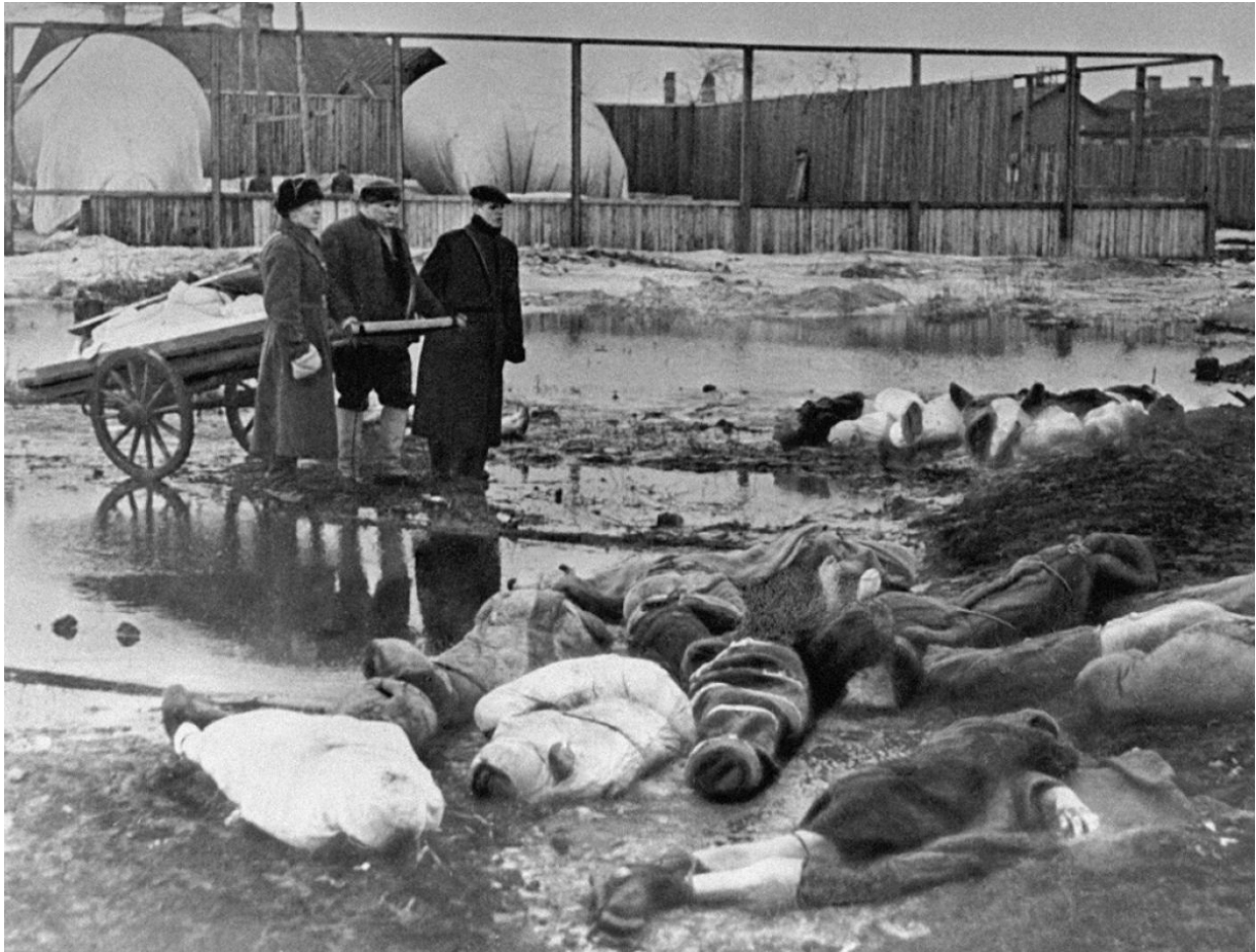
Drei Männer begraben Hungertote auf dem Wolkowo-Friedhof in den Tagen des Massensterbens, Oktober 1942; https://de.wikipedia.org/wiki/Leningrader_Blockade#cite_ref-10

Schätzungen zufolge starben 600.000 bis 1,2 Millionen Menschen, hauptsächlich Zivilisten, meist an Hunger und Kälte.